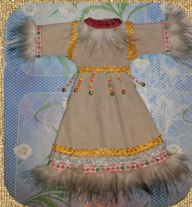
Кафтан женский вид с зади