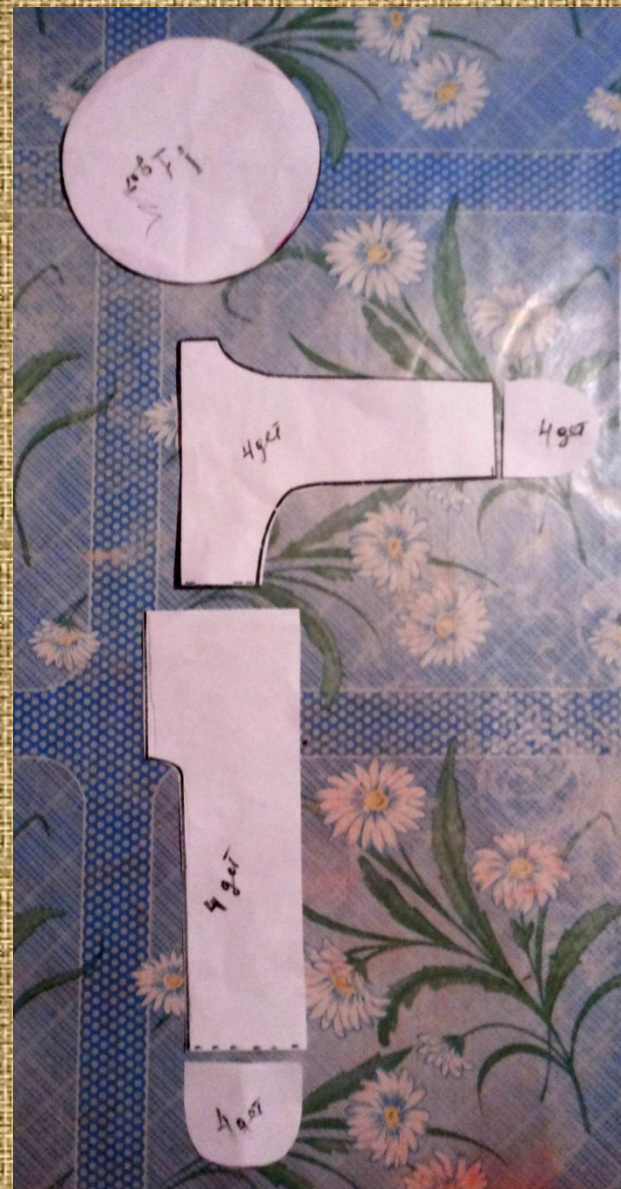
Выкройка из бумаги