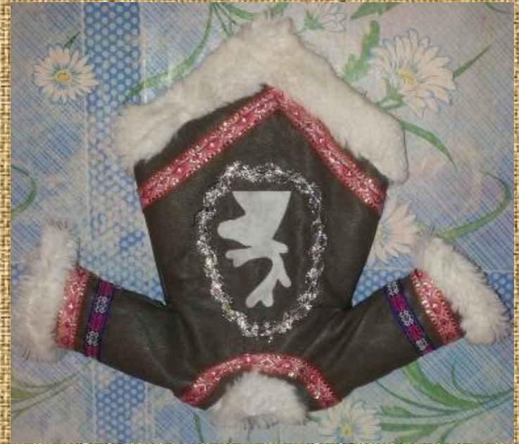
Кафтан – мирэлэн вид с зади