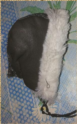
Мужская шапка - Капор - авун