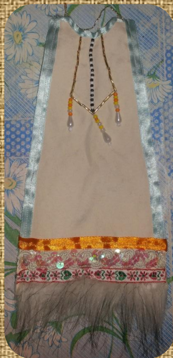
Женский нагрудник - нелли