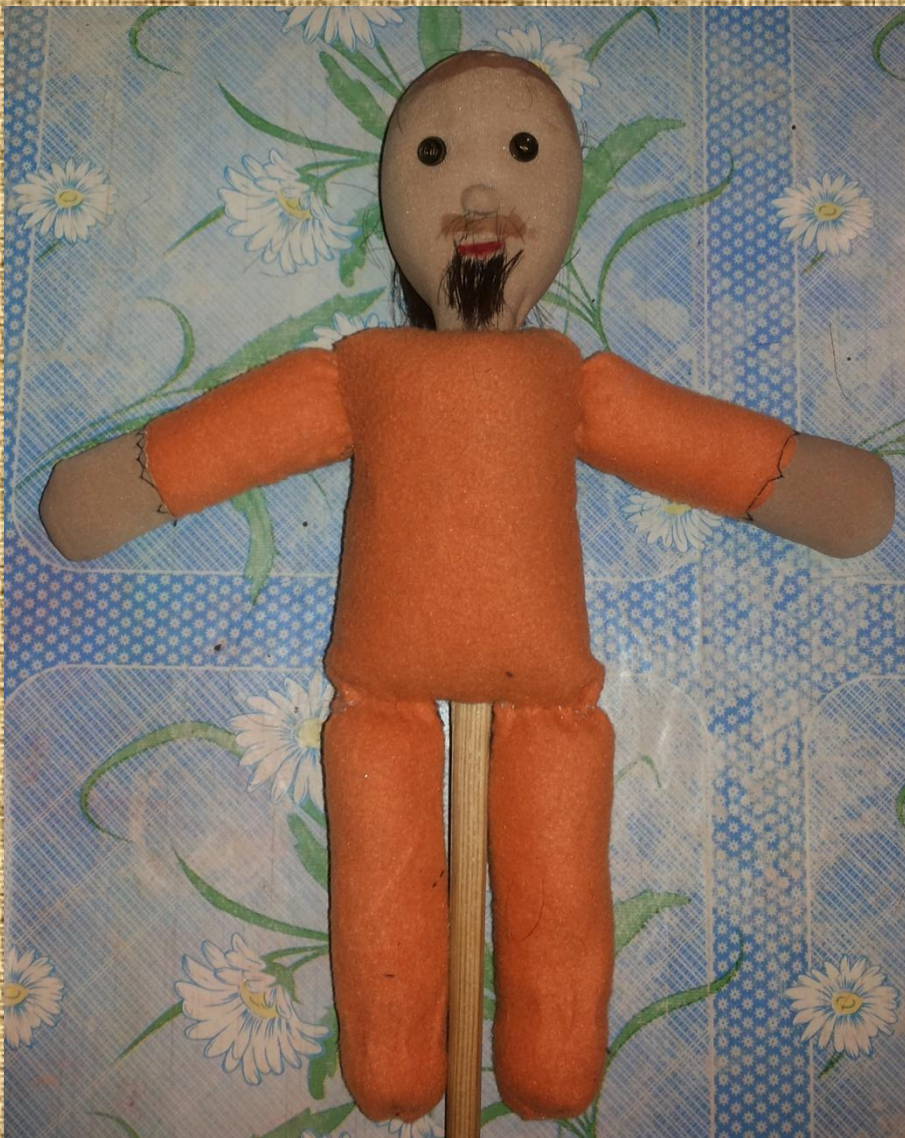
Кукла для кукольного театра