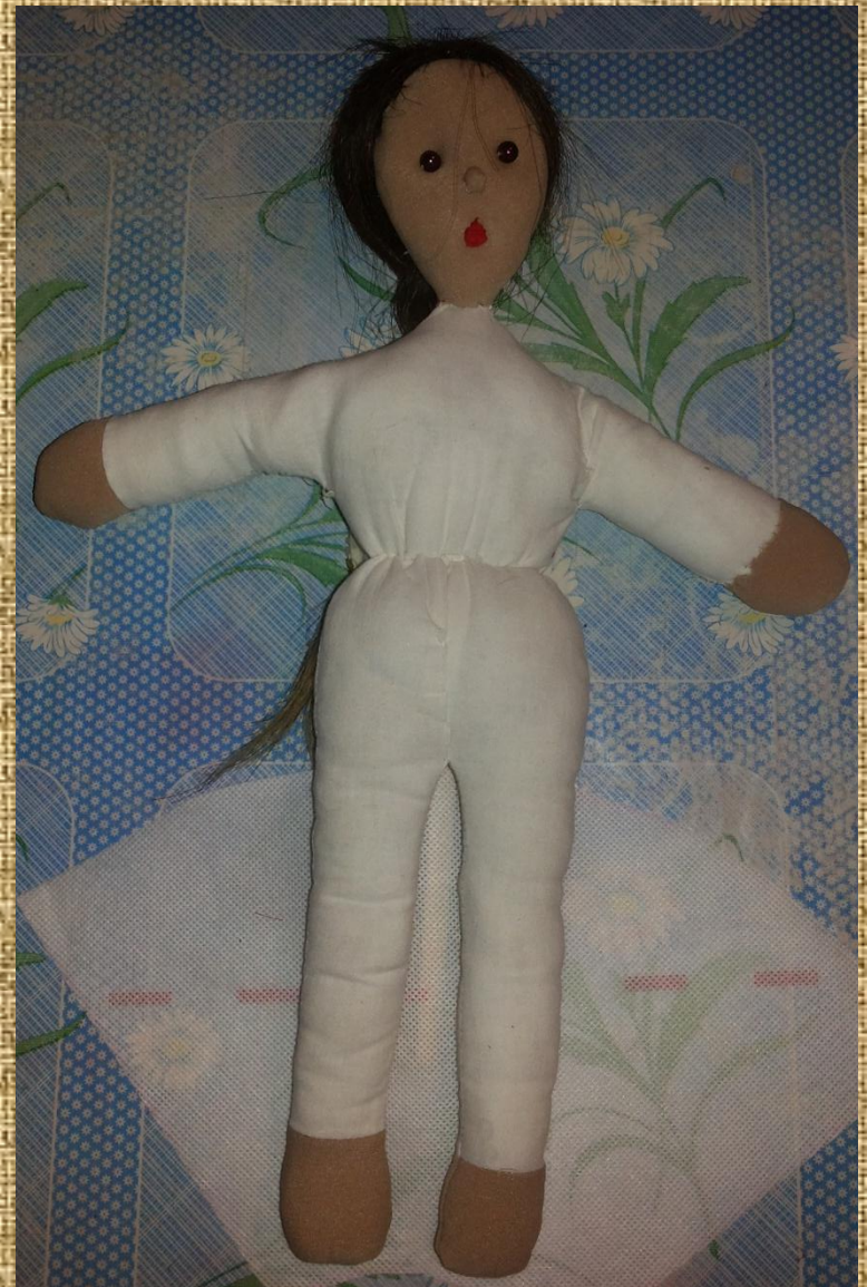
кукла для кукольного театра