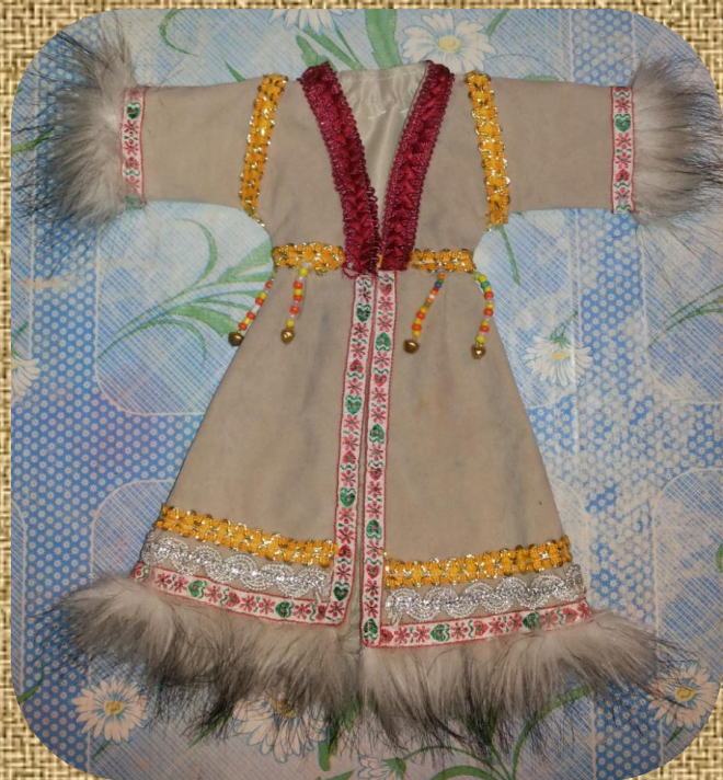
Кафтан женский вид с переди