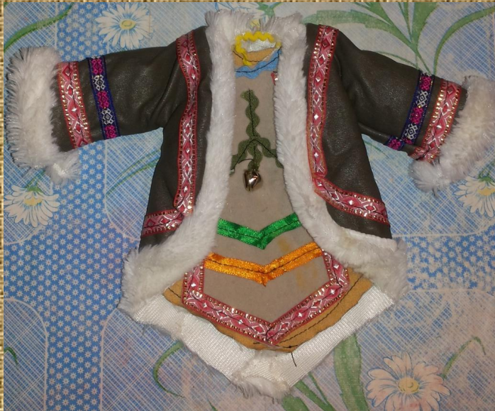
Кафтан – мирэлэн вид с переди