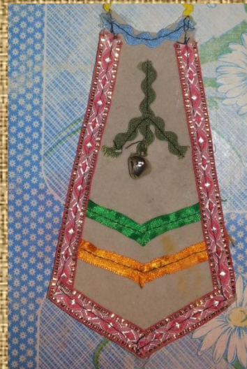
Мужской нагрудник - Хэлли