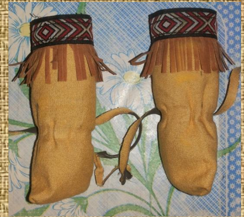
Летняя обувь - локоми