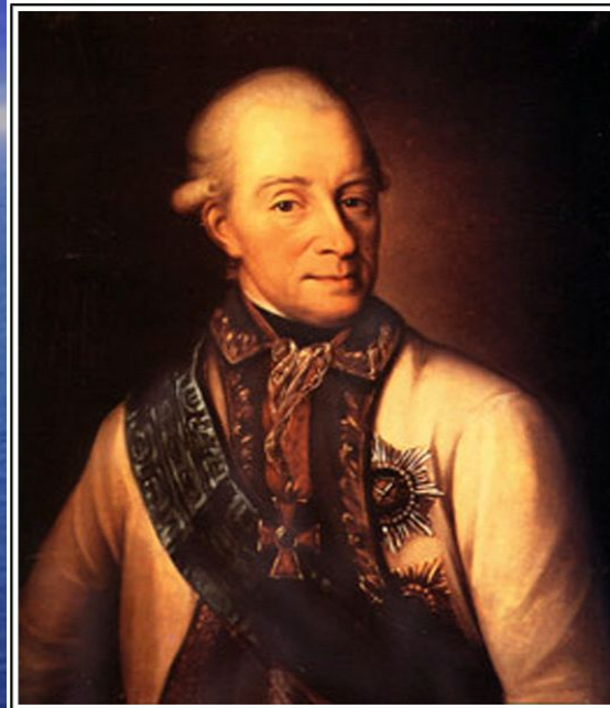
Адмирал В.Я. Чичагов.