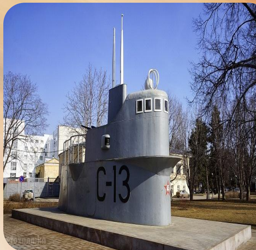
Рубка подводной лодки С-13.