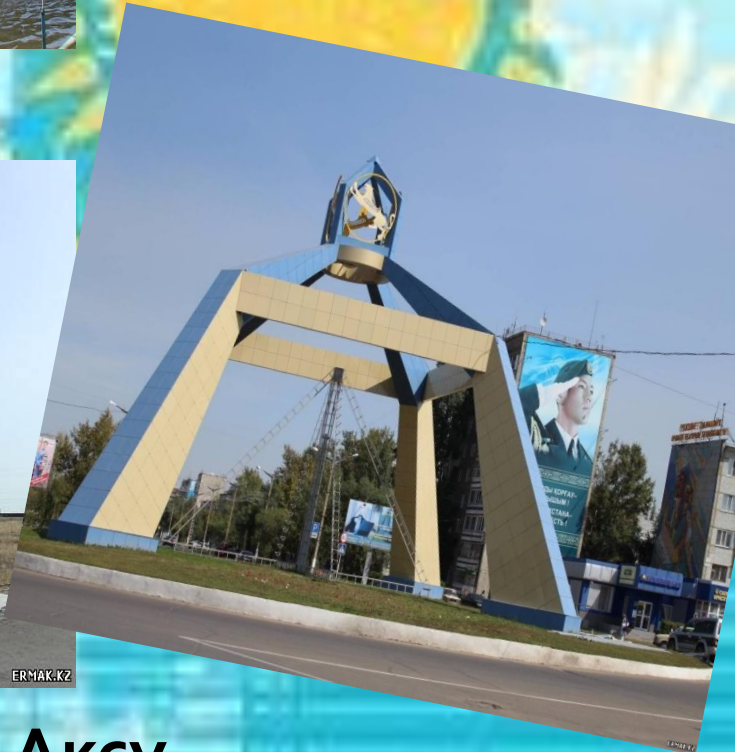
Наш родной город Аксу