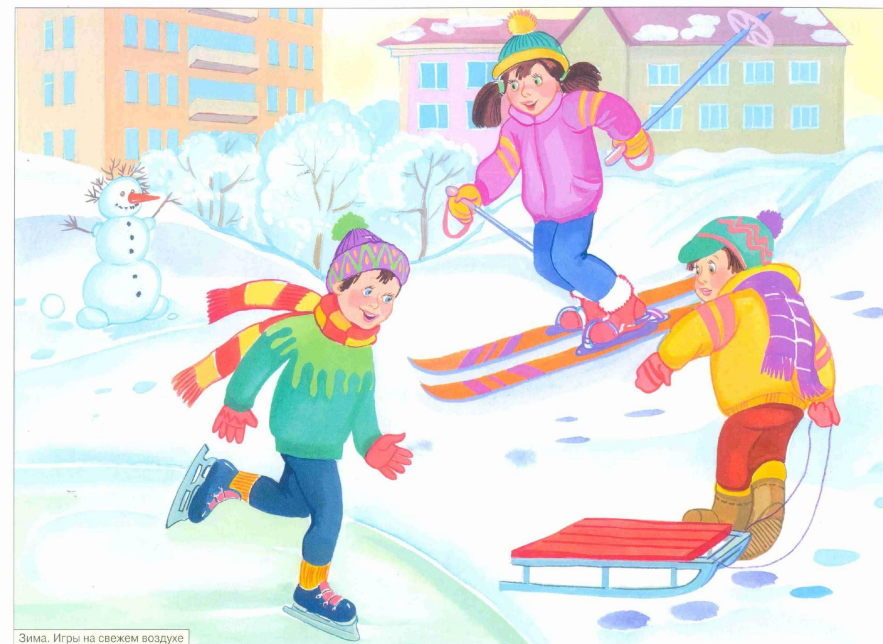
Зима. Игры на свежем воздухе