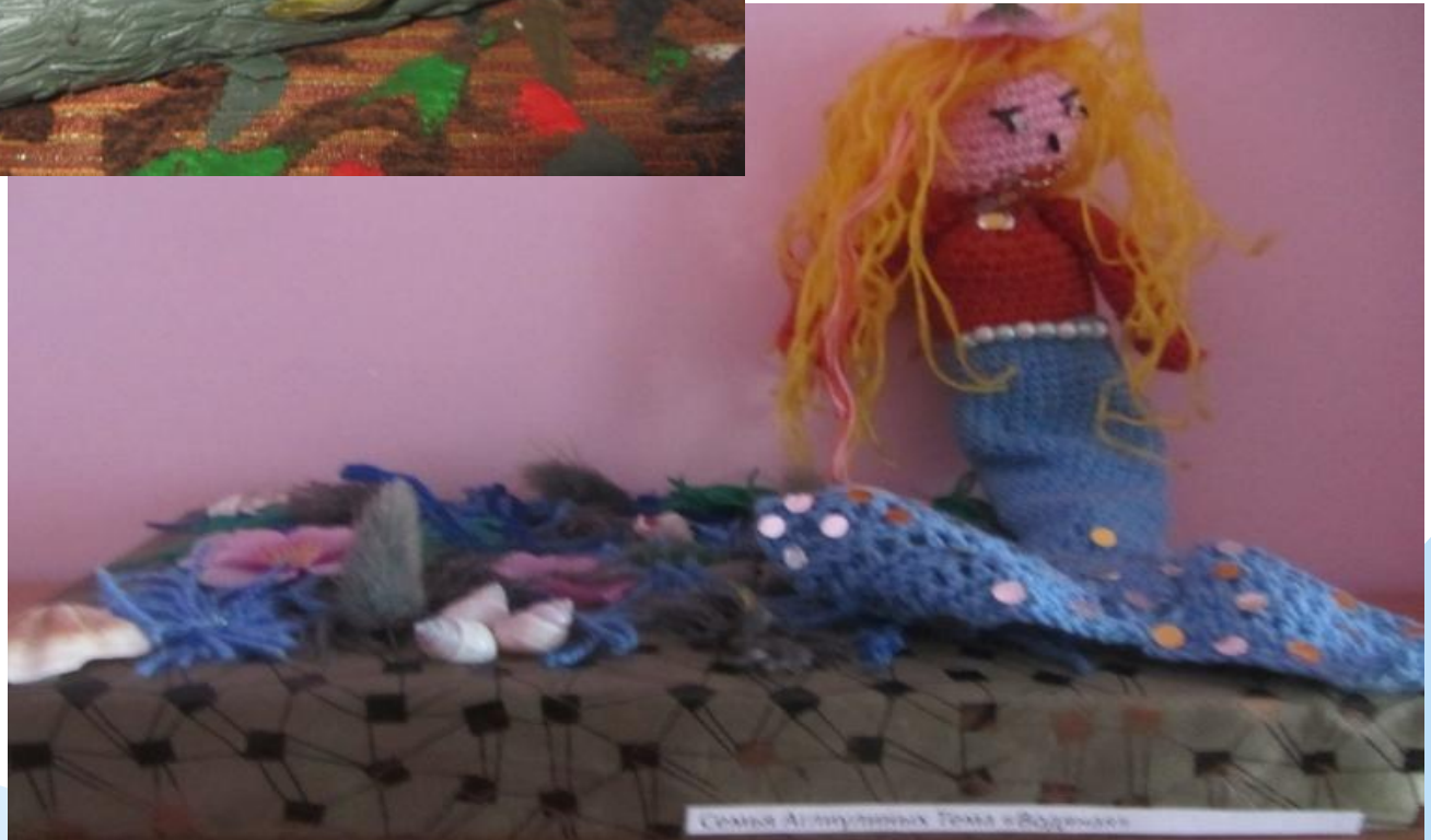
Семья Алмазчиных, Тема «Волшебство»