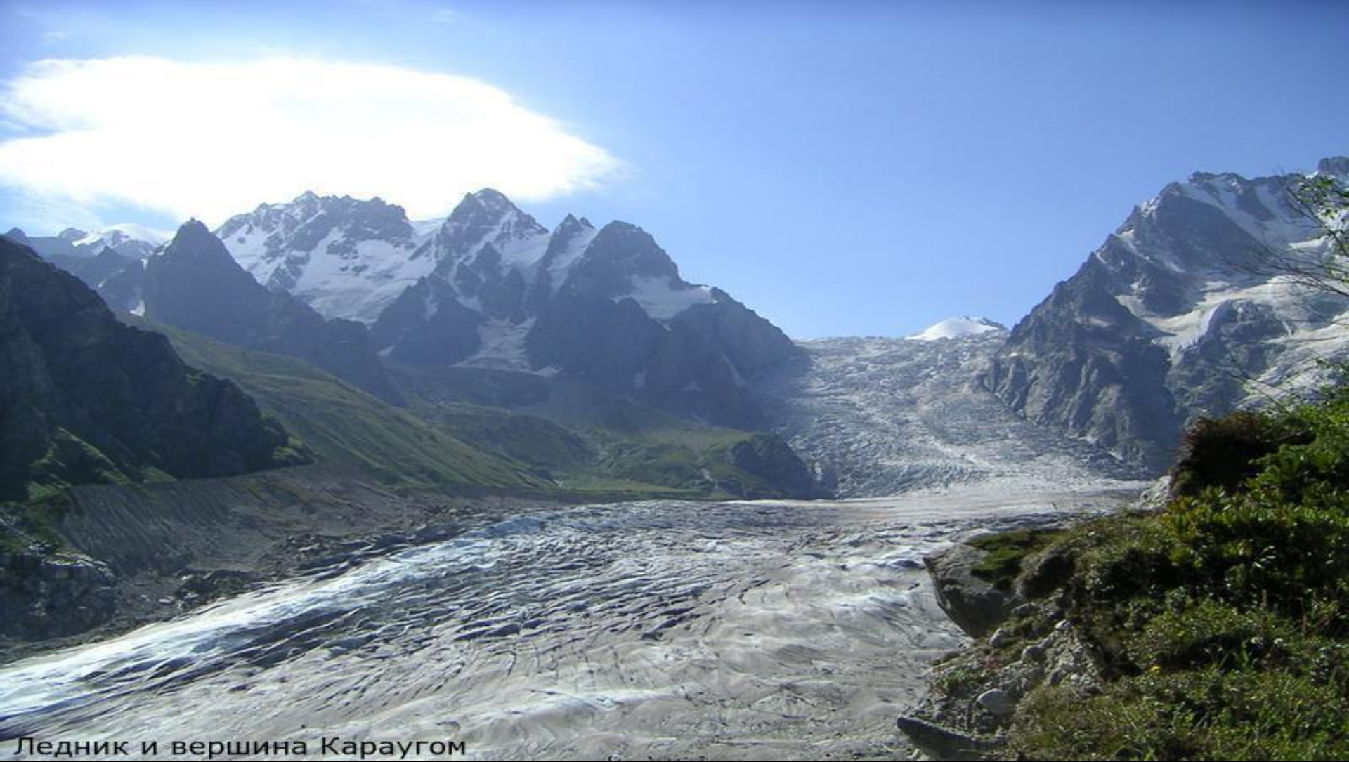
Ледник и вершина Караугом