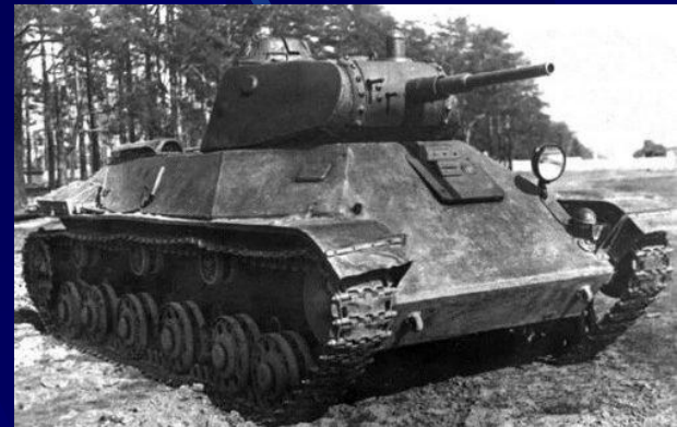
Легкий танк Т-50