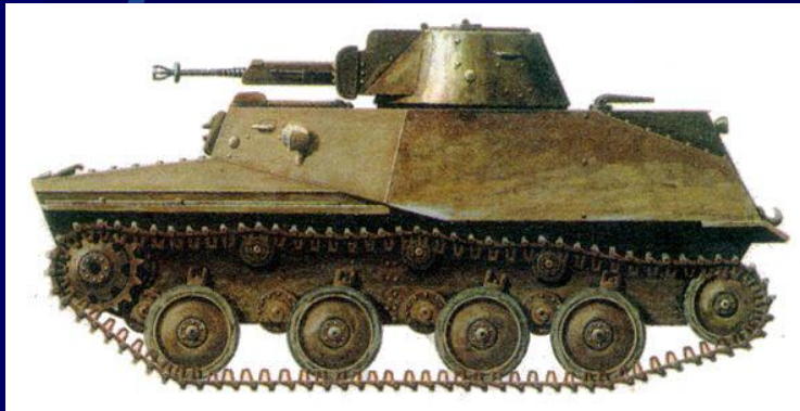
Плавающий танк Т-40