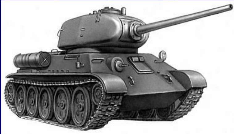
Средний танк Т-34