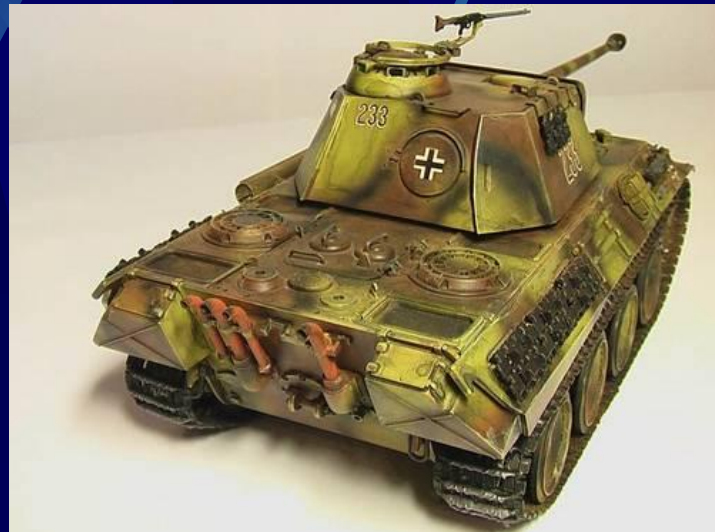
Средний танк - Пантера