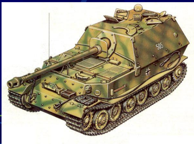
Самоходное орудие Фердинанд