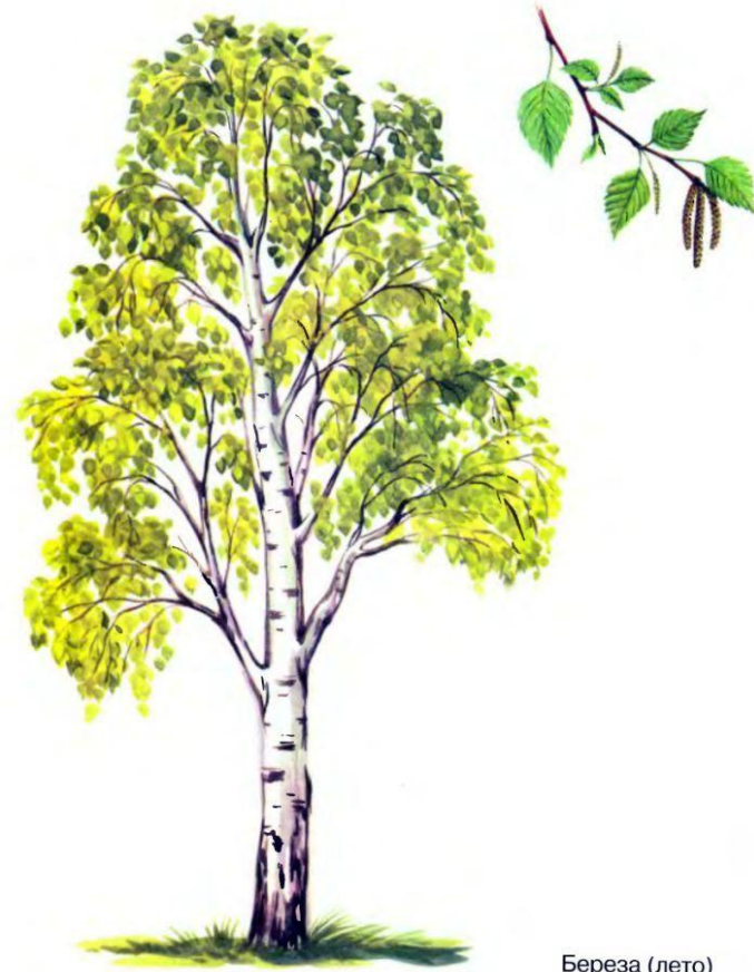
Береза (лето) mirnitska.od.ua