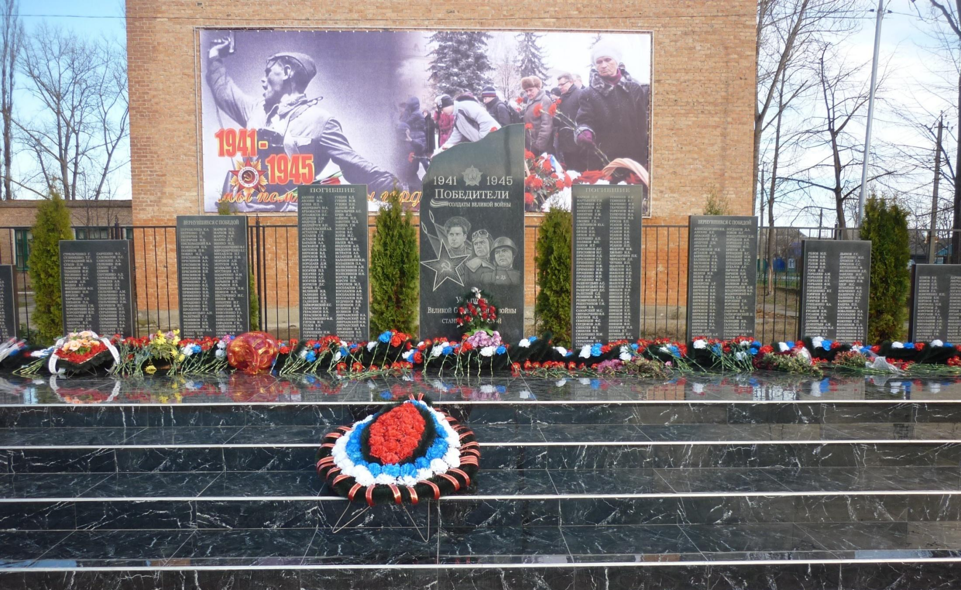
Памятник участникам Великой Отечественной Войны. Жителям станицы Луковской.