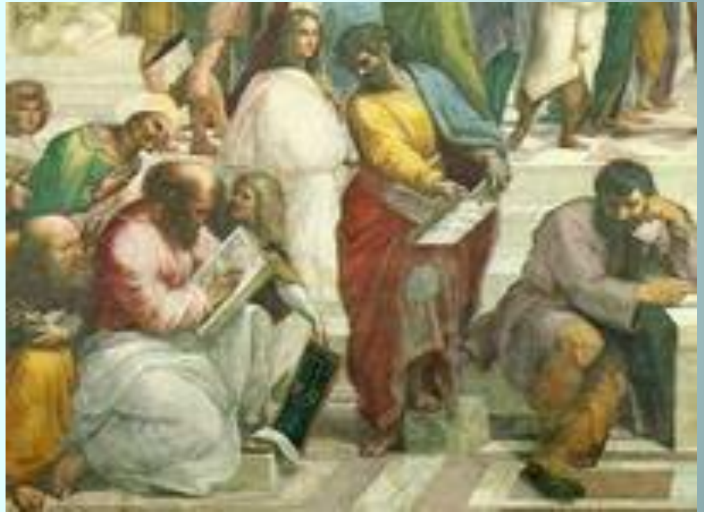
Пифагорейцы - последователи Пифагора