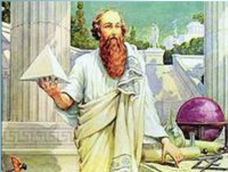
Пифагор, греческий философ и математик