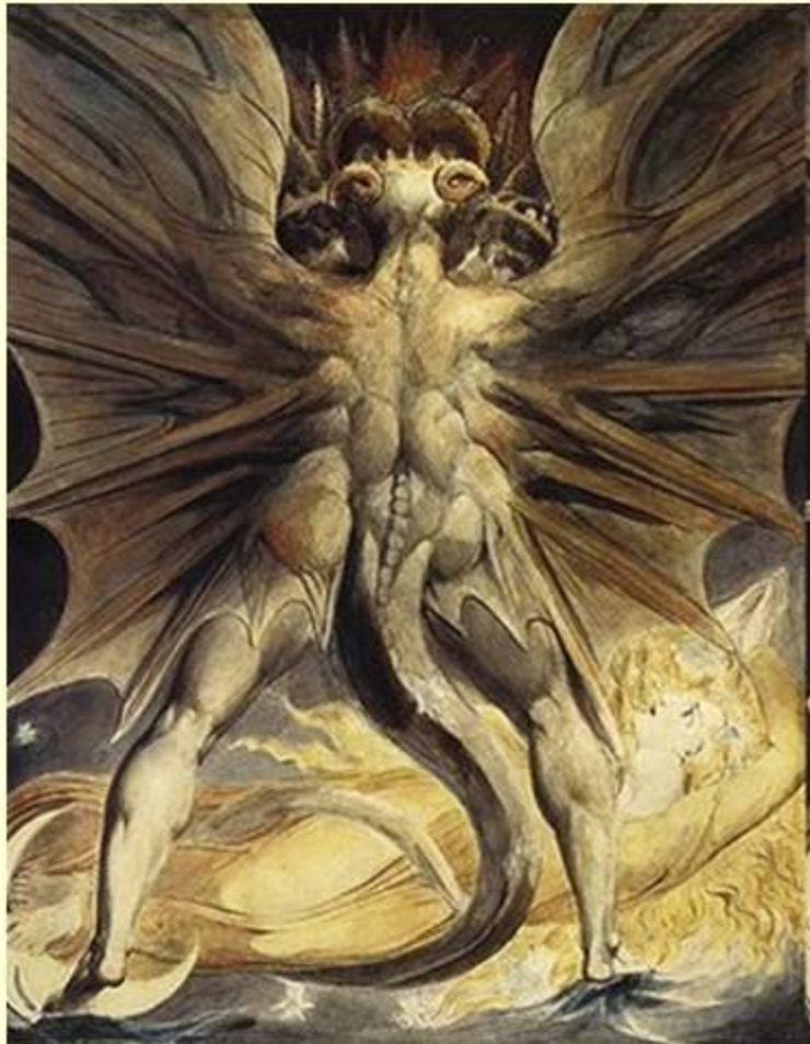
Картина Уильяма Блейка .

Зло — понятие нравственности , противоположное понятию добра , означает намеренное, умышленное, сознательное причинение кому-либо вреда, ущерба, страданий.