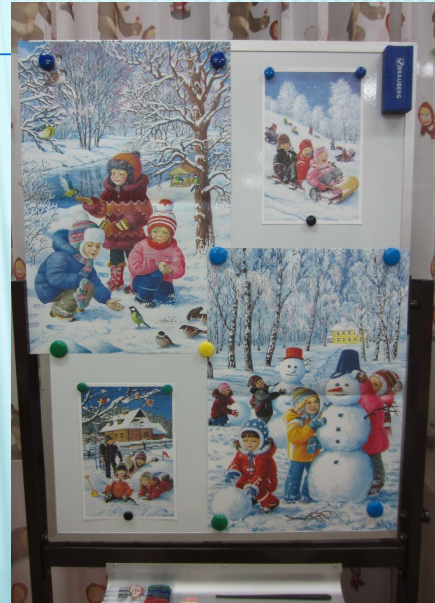
Демонстрационный материал «Зимушка-зима»