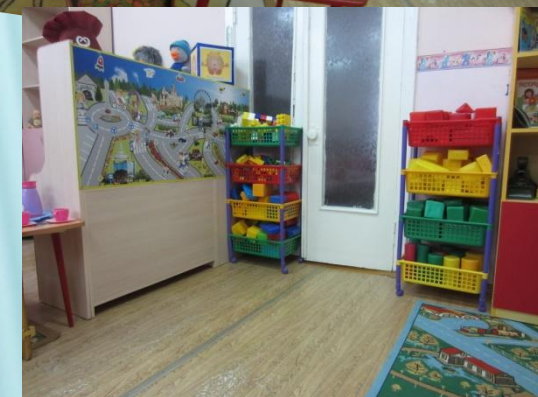
Центр «Гендерное воспитание»

Центр сюжетно-ролевых игр позволяет создавать условия для творческой деятельности детей, развития фантазии, формирования игровых умений, реализации игровых замыслов, воспитания дружеских взаимоотношений между детьми. Центр оснащен уголками и атрибутами для сюжетно-ролевых игр, подобранных с учетом возрастных особенностей детей и гендерной принадлежностью – куклами, машинами, игрушечными дикими и домашними животными.