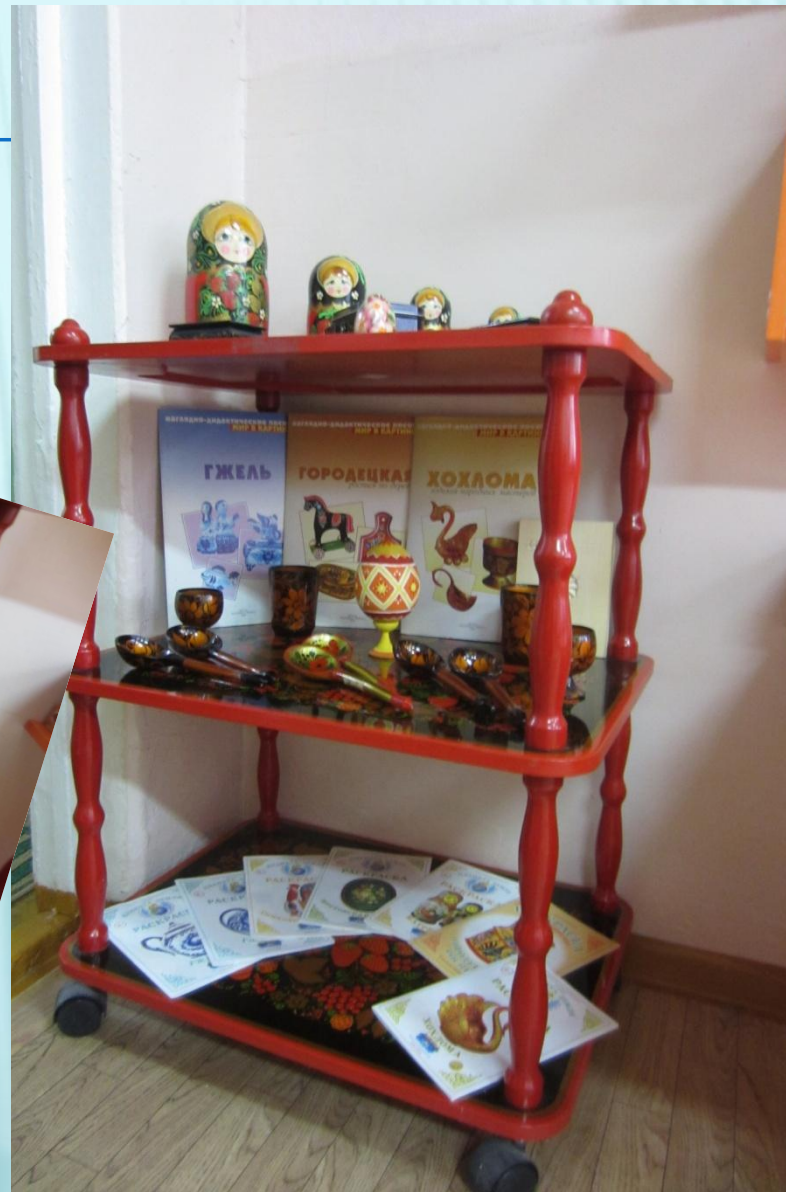
Мини-музей «Русское - народное творчество»