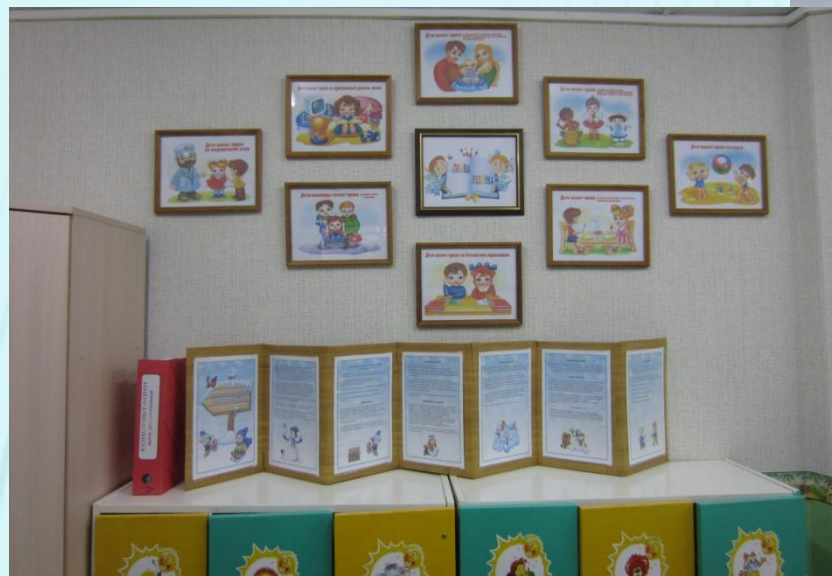
Информационный материал «Права ребенка»

в котором размещен материал о текущей деятельности группы