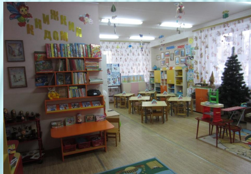
Нижняя правая точка