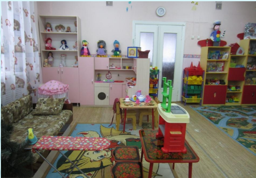
Верхняя левая точка