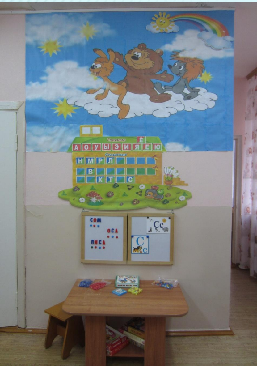
«Звуки и буквы»