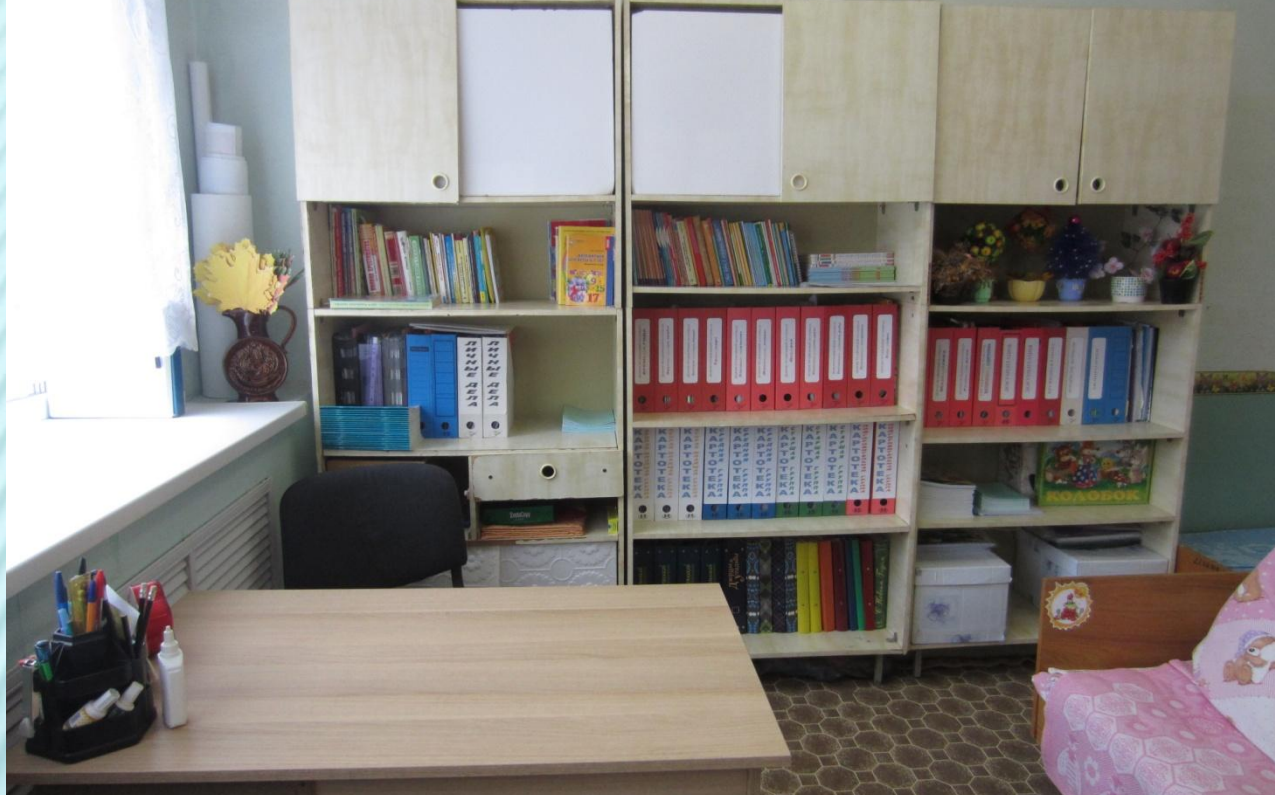
Методическая литература воспитателя