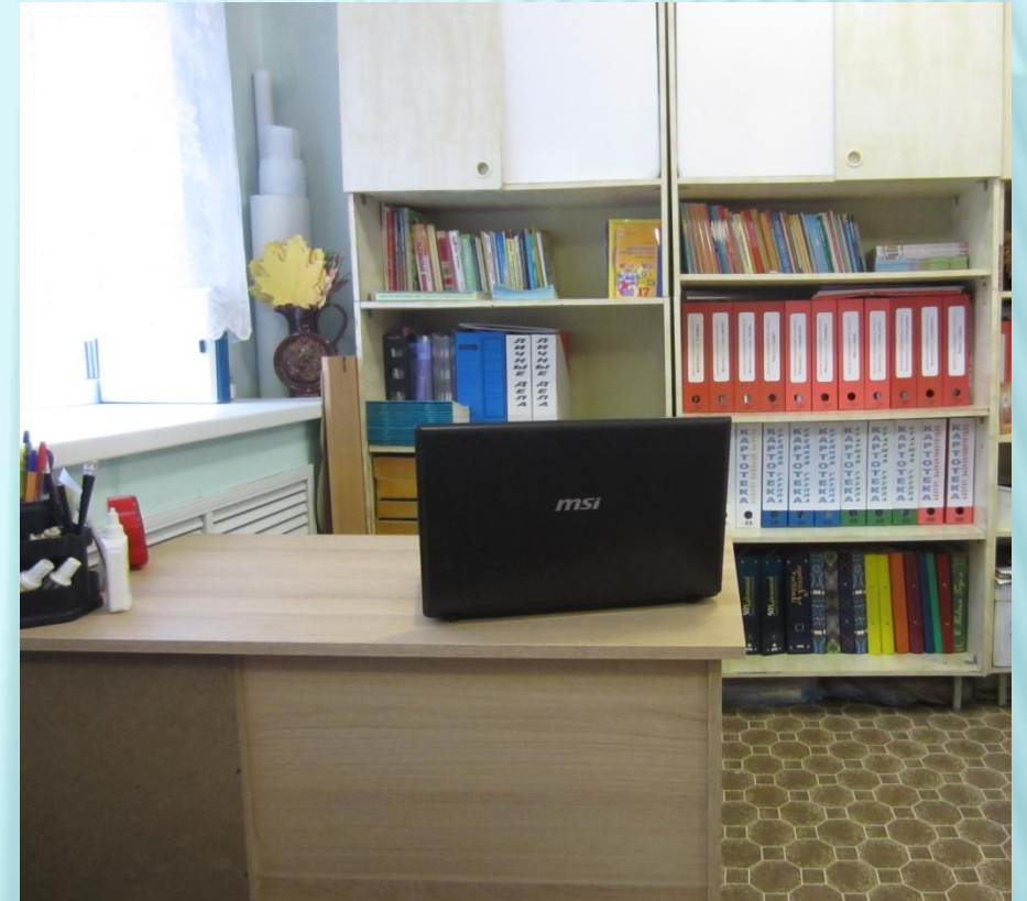
ИКТ для педагога