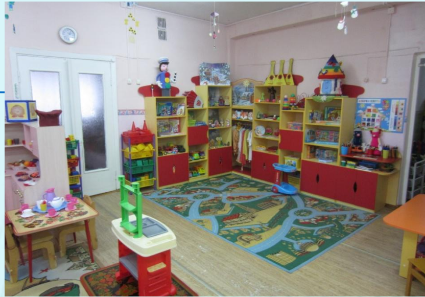
Верхняя правая точка