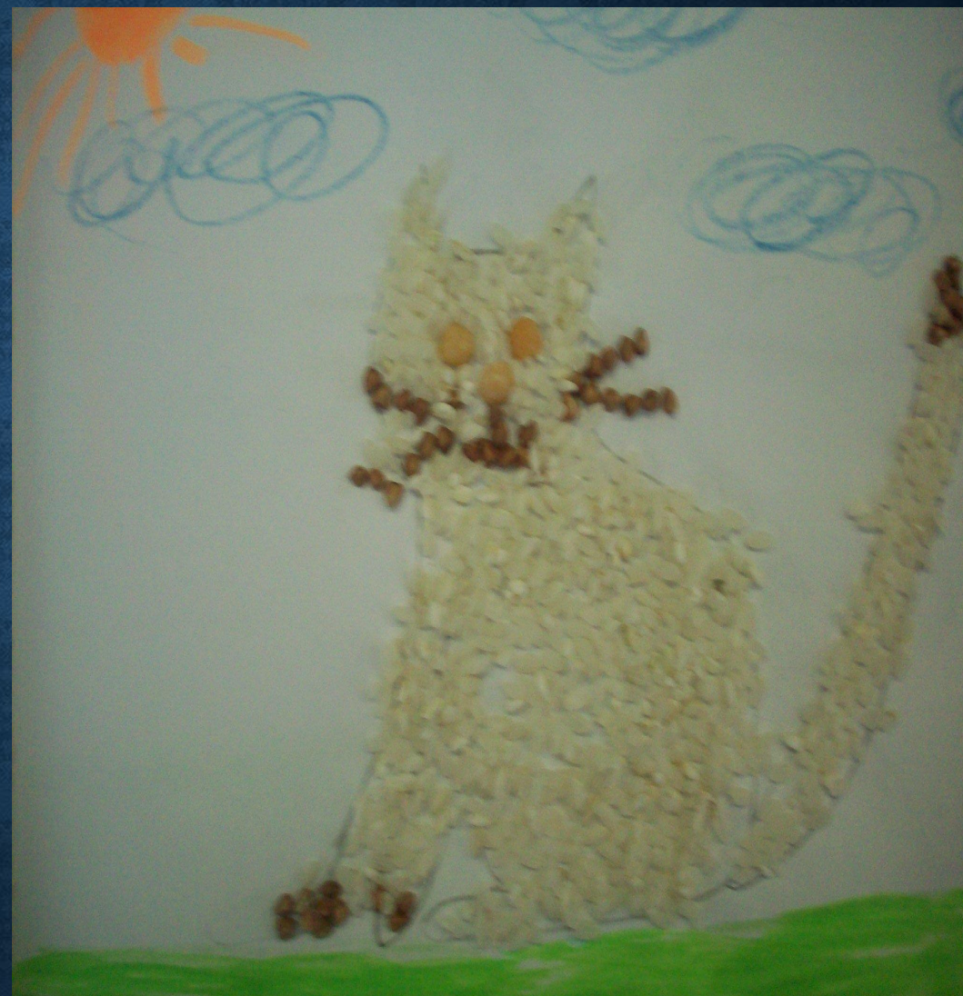
Работа «Кошка» выполнена в технике: аппликация из риса.