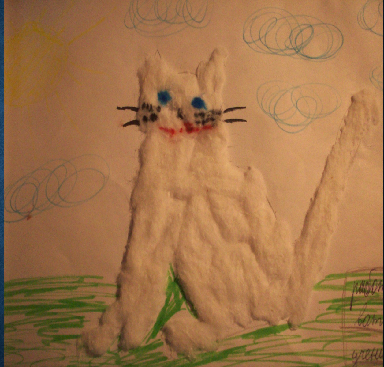
Работа «Кошка» в технике: аппликация из ваты.