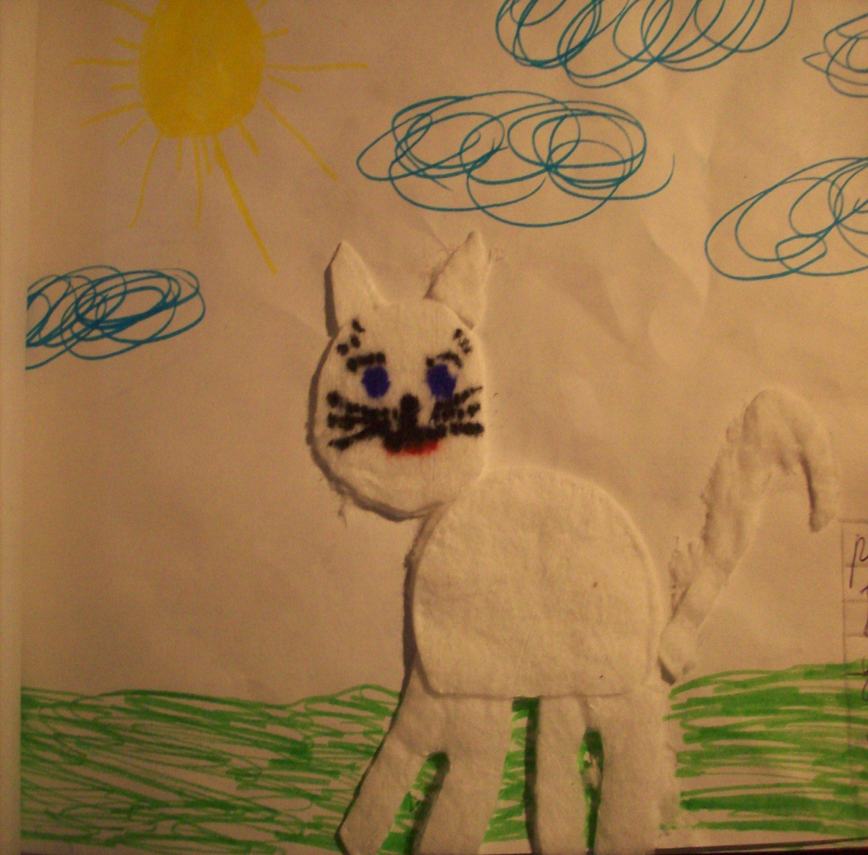
Работа «Кошка» в технике: аппликация из ватных дисков.