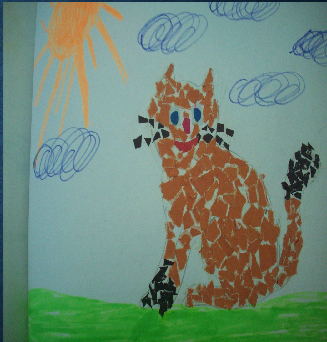
Работа «Кошка» в технике: рванная мозаика.