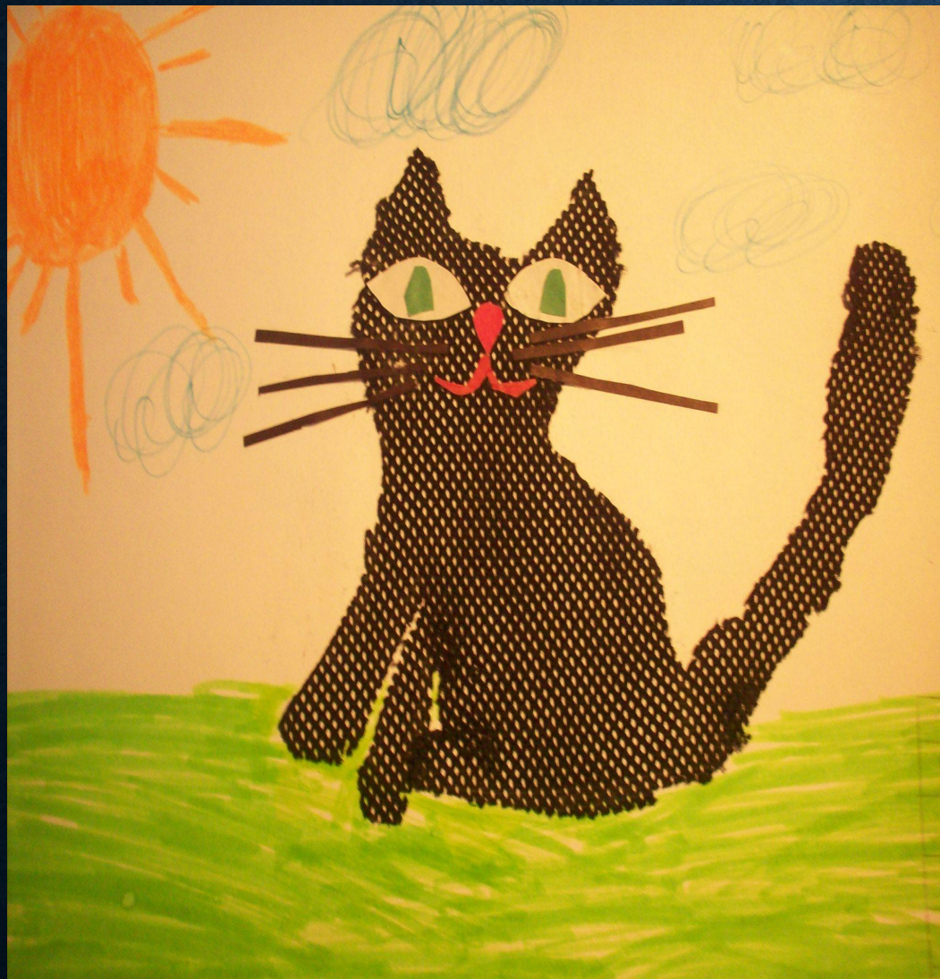
Работа «Кошка» в технике : аппликация из ткани.