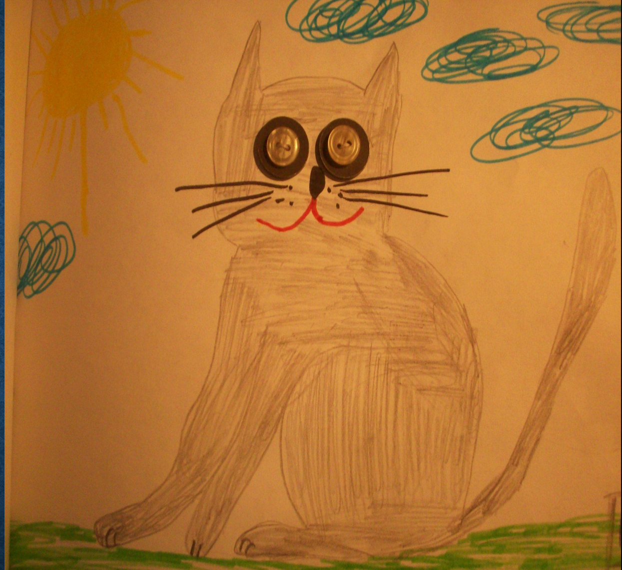
Работа «Кошка» в комбинированной технике, с применением