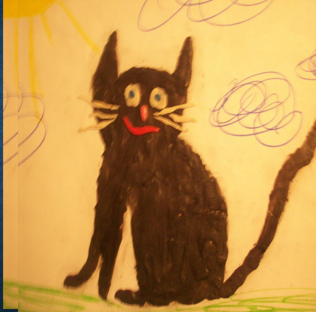
Работа «Кошка» выполнена пластилином.