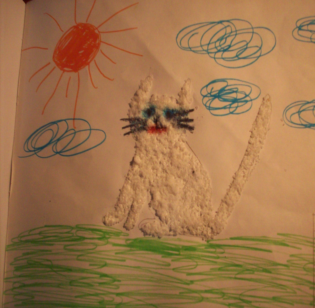
Работа «Кошка» в технике : аппликация солью.