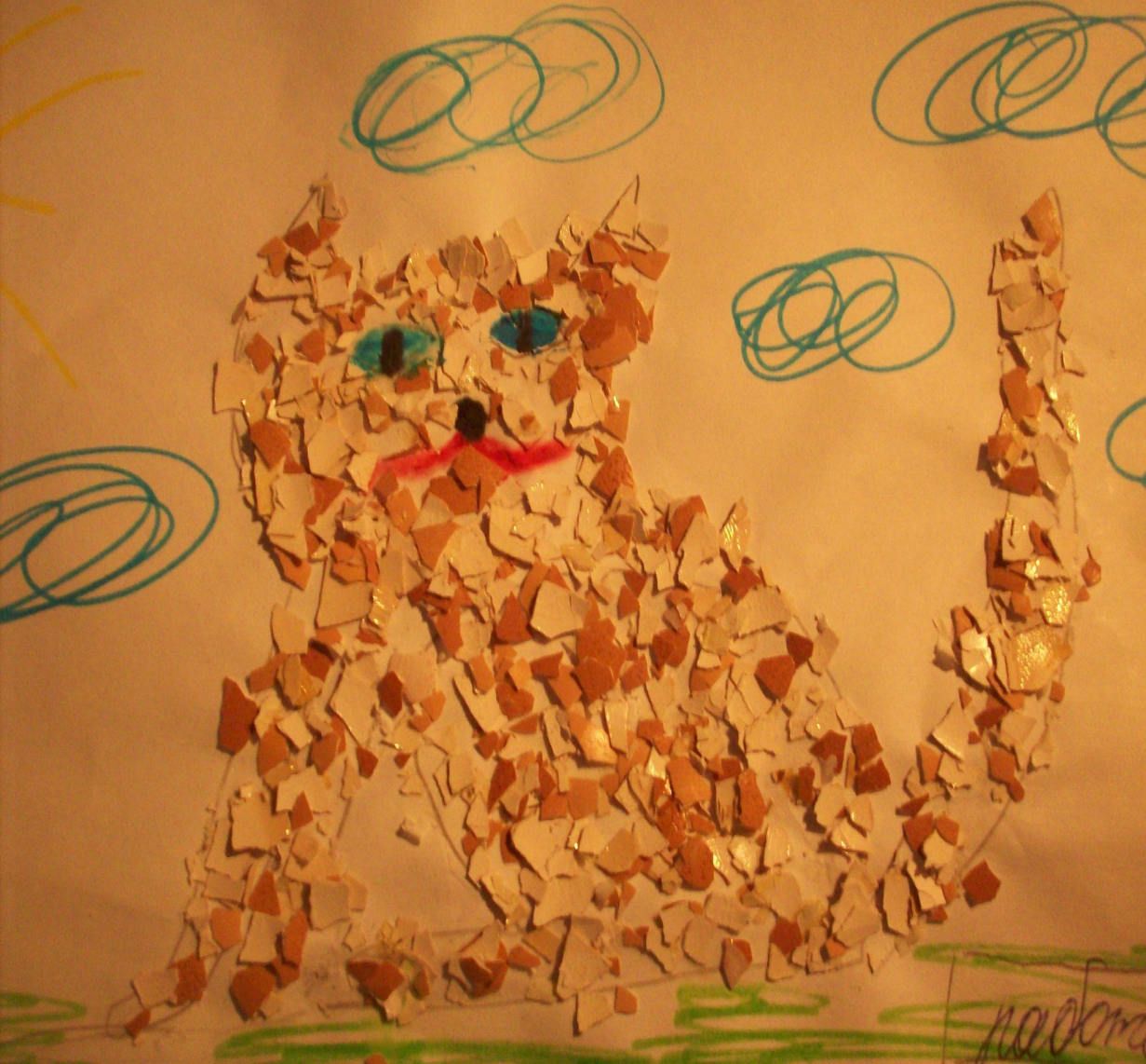
Работа «Кошка» в технике: аппликация из яичной скорлупы.