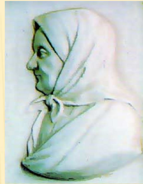
ЯКОВЛЕВА АРИНА РОДИОНОВНА

ЛЮБОВЬ К РОДНОМУ ЯЗЫКУ МАЛЕНЬКОМУ ПУШКИНУ ПРИВИЛИ БАБУШКА, МАРИЯ АЛЕКСЕЕВНА ГАННИБАЛ, ПРЕВОСХОДНО ГОВОРИВШАЯ И ПИСАВШАЯ ПО-РУССКИ, И НЯНЯ АРИНА РОДИОНОВНА.