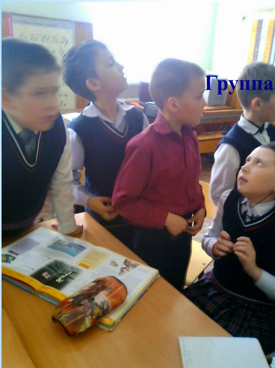
Группа в момент завершения работ