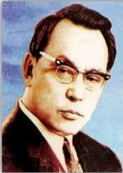
ЖЖҰЖҰБАН МОЛДАҒАЛИЕВ (1920—1988)

Жұбан Молдағалиев 1920 жылы, қазанның бесінші жұлдызы, Орал облысының, Тайпақ ауданы, Жыланды ауылында дүниеге келген. Мектептен кейін Орал ауыл шаруашылығы техникумында оқыған.