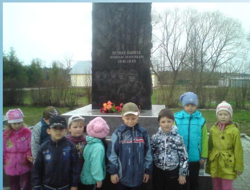
Участие в митингах, посещение памятников