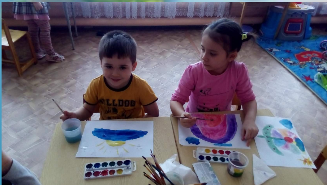
Рисунки к Дню герба и флага