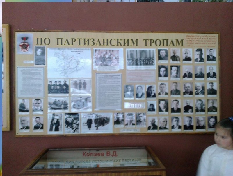
Экскурсия в зал боевой славы в МОУ «Микулинская гимназия»