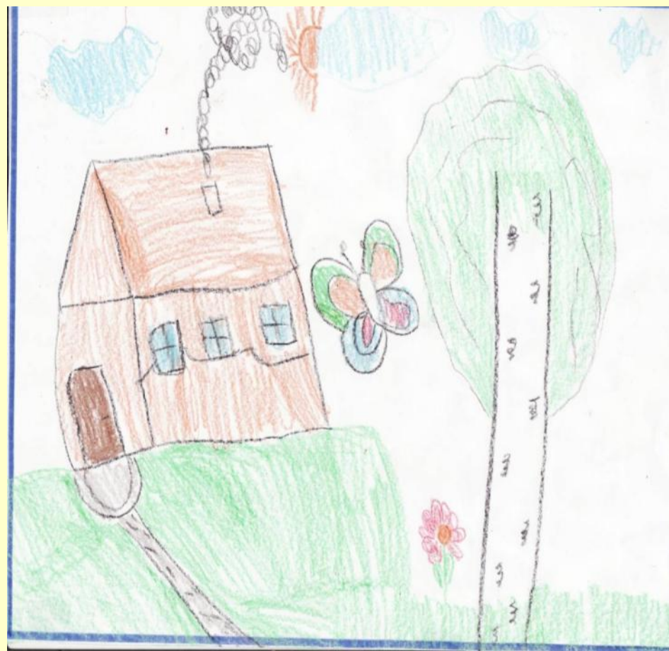
Рисунки детей «Село мое родное»