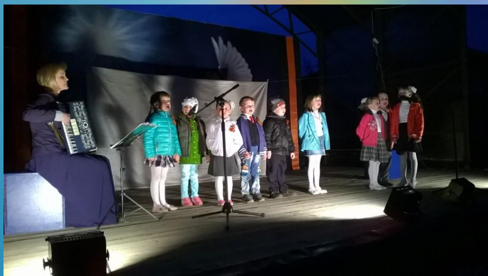
Концерты, посвященные Дню победы