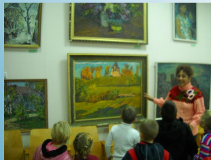
Экскурсия в краеведческий музей и картинную галерею с.Микулино