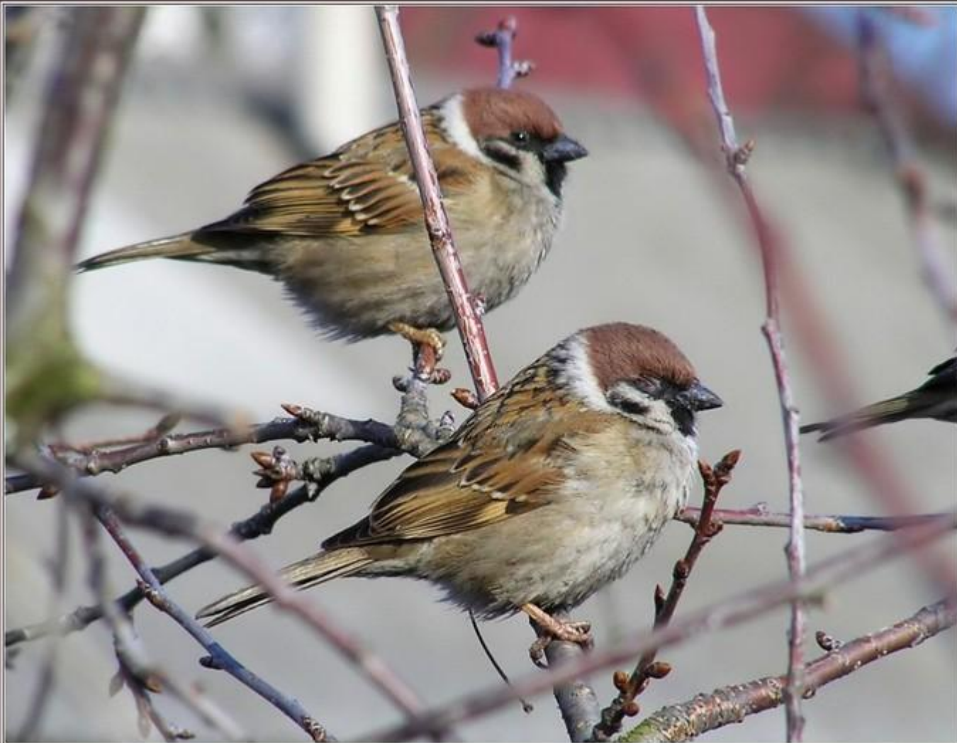
Воробьи полевые ( Passer montanus ) ♂ ♂