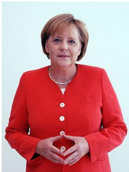
Федеральный канцлер Германии Ангела Доротея Меркель

Форма государственного правления в Германии - парламентская республика. Пост федерального канцлера ФРГ с 2005 года занимает Ангела Меркель. Германия является членом Европейского союза и НАТО, входит в «Большую восьмёрку», претендует на постоянное членство в Совете Безопасности ООН.