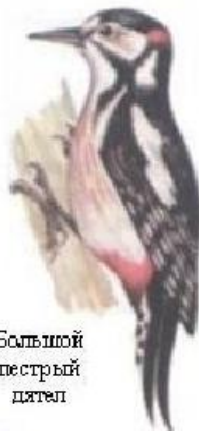
Большой пестрый дятел