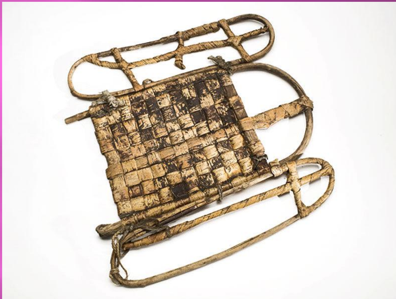
Рюкзак первобытного человека