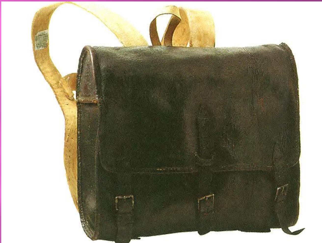
Пехотный ранец 1808 год