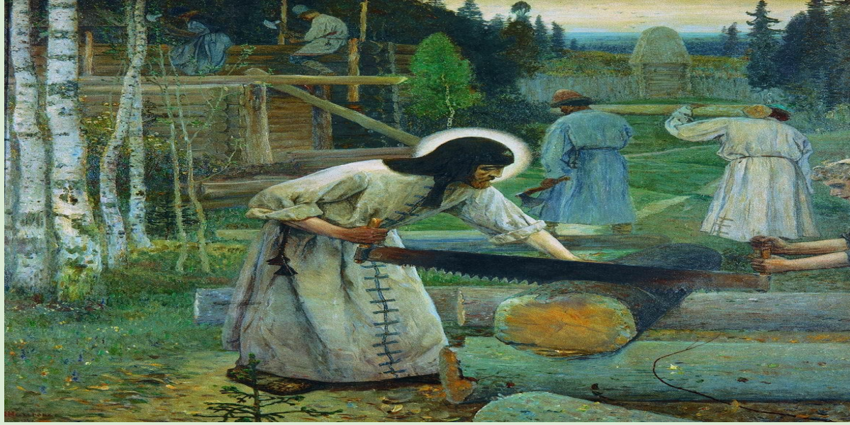
Юность Преподобного Сергия. Нестеров М.В.