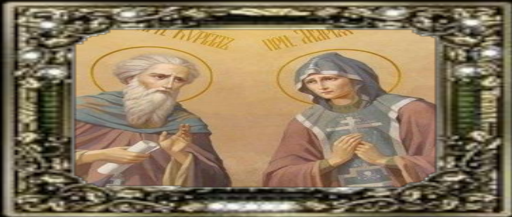
Св.прп. Кирилл и Мария. Роспись Вознесенского храма на Гродке (Павлов-Посад)