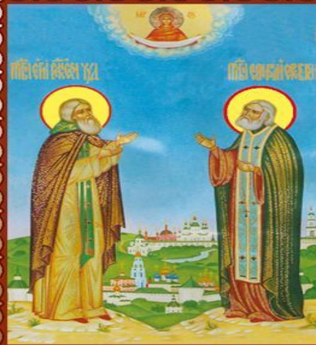
Прп. Сергий Радонежский и Серафим Саровский