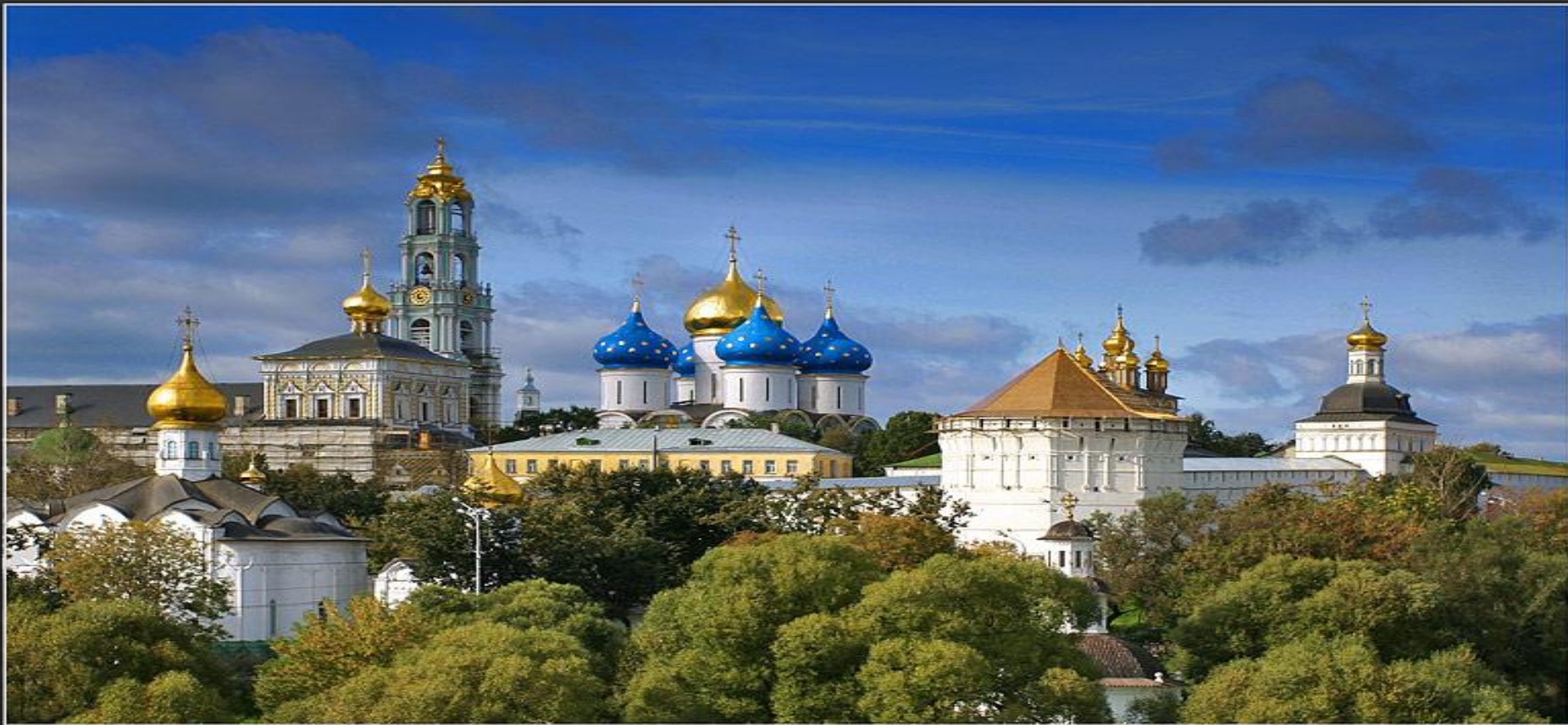
Свято-Троицкая Сергиева Лавра