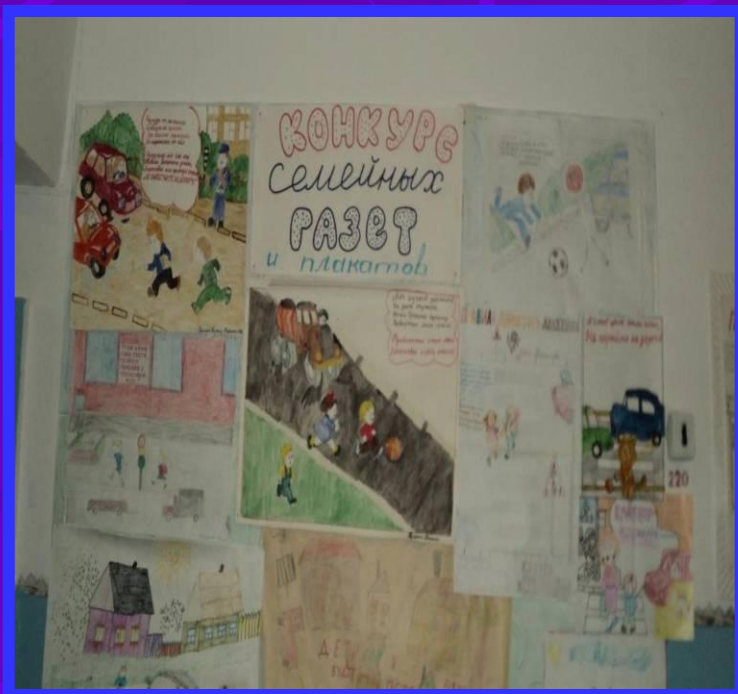
Конкурс семейных газет по ППД