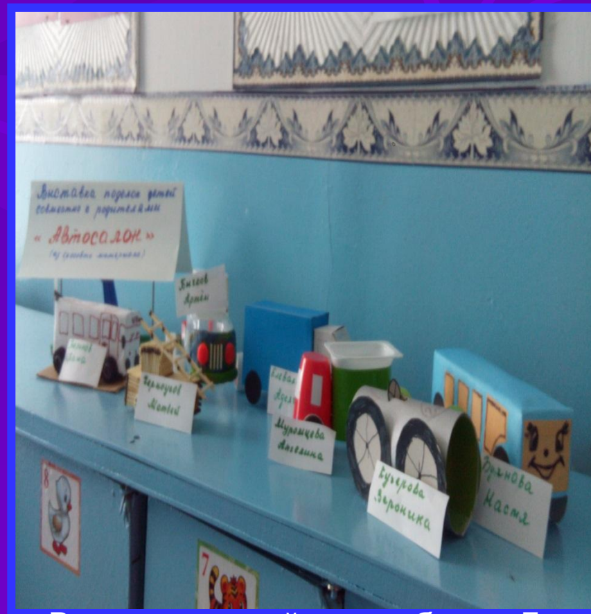
Выставка семейных работ ко Дню технических достижений