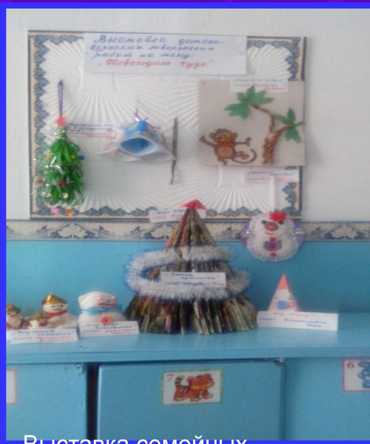
Выставка семейных Новогодних поделок