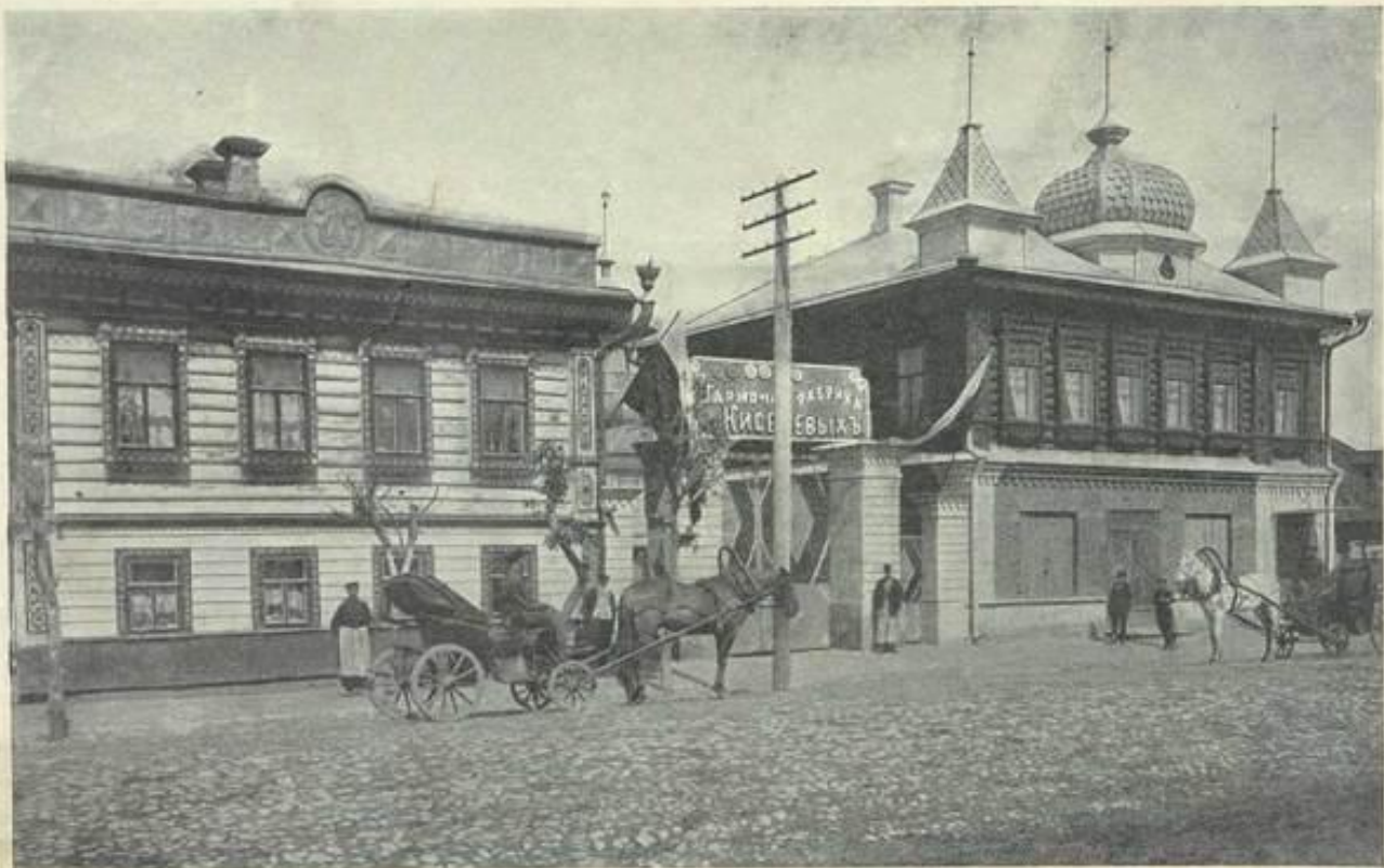
Видъ фабрики Бр. КИСЕЛЕВЫХъ.