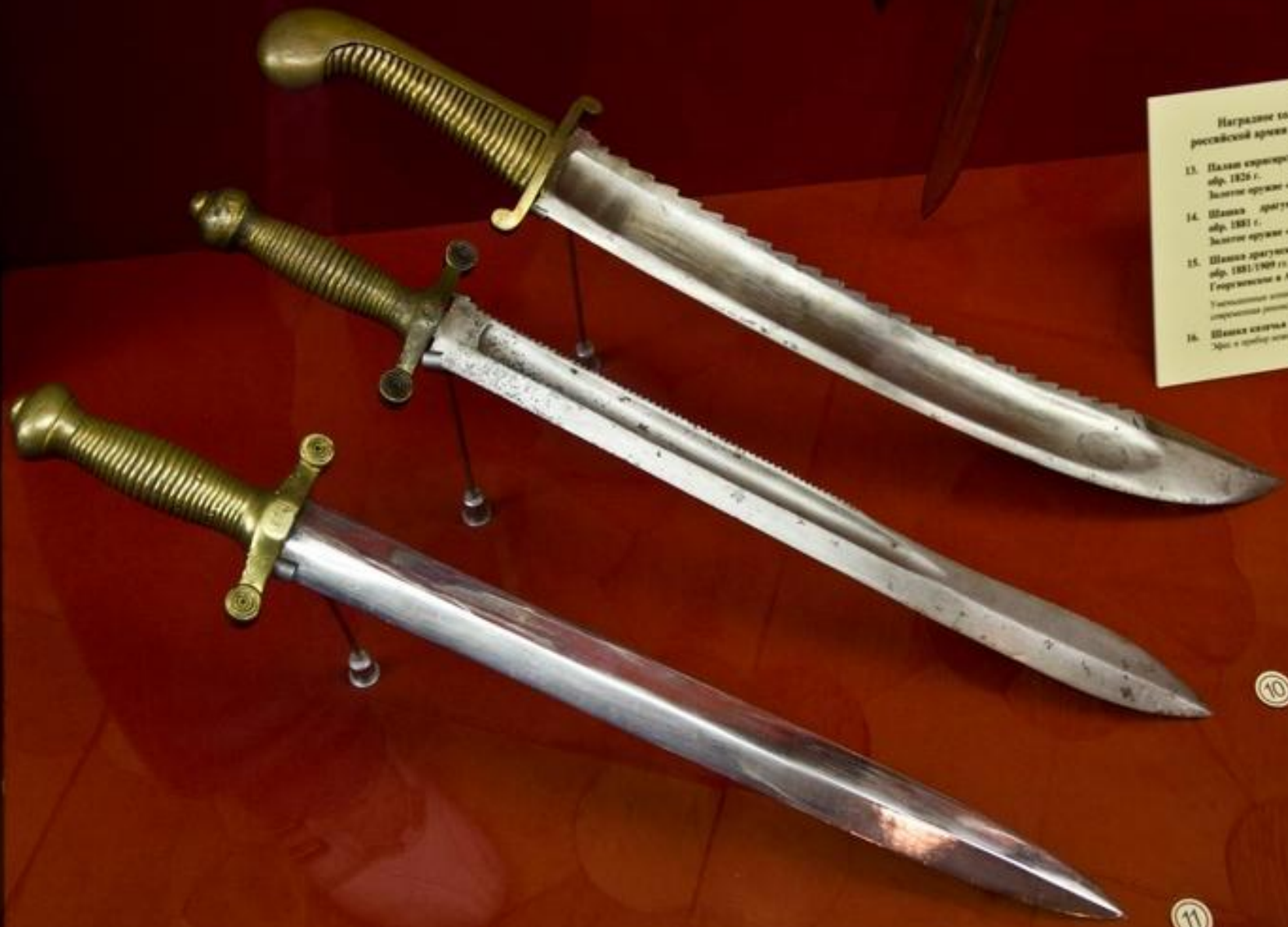
Награжденные золотым оружием русской армии XIX – начала XX в. 13. Палаш кирасирский офицерский обр. 1826 г. Золотое оружие «За храбрость» 14. Шашка драгунская офицерская обр. 1881 г. Золотое оружие «За храбрость» 15. Шашка драгунская офицерская обр. 1881/1909 гг. Георгиевские и Аннинские оружие Украинскими воинами во время гражданской войны (Украинская республика) 16. Шашка кавалерийская (Губарев) Мед. и орденом Анны Георгиевский воине