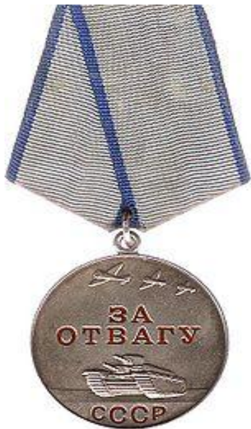
Медаль «За отвагу» (1942 год)