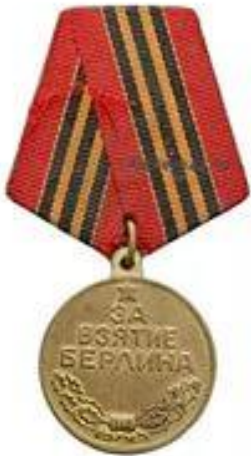
Медаль «За взятие Берлина»