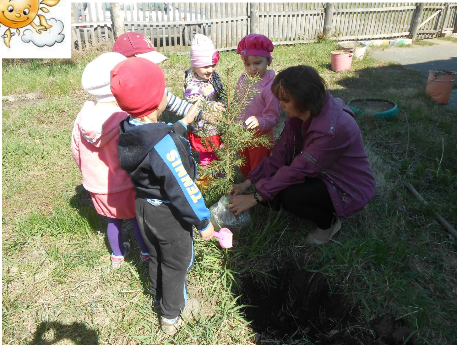
Посадка сосны на участке