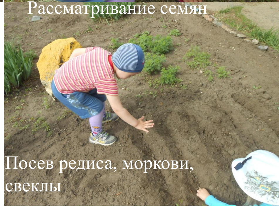
Посев редиса, моркови, свеклы