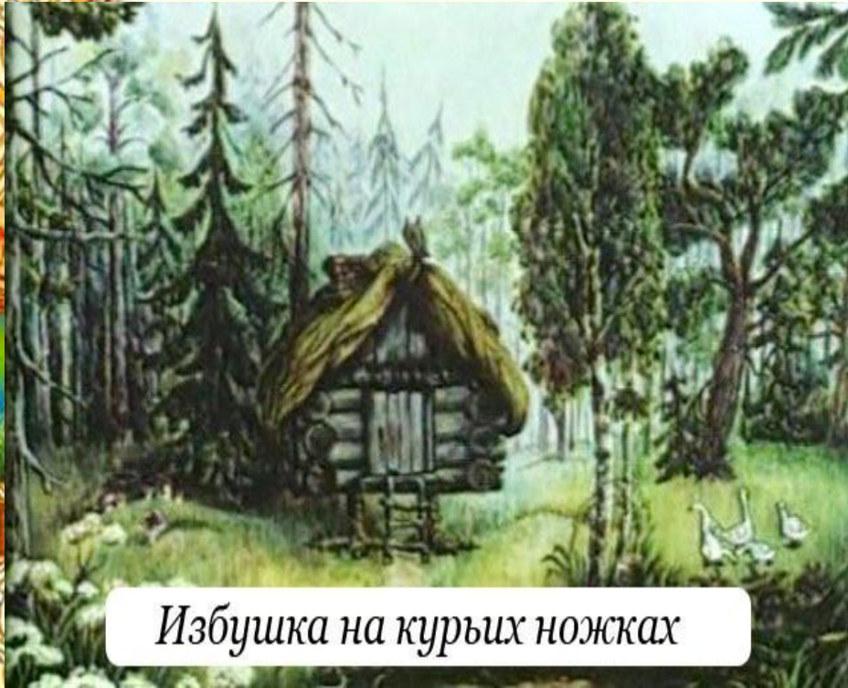
Избушка на курьих ножках

Живет Баба- Яга в дремучем лесу, в избушке на курьих ножках.