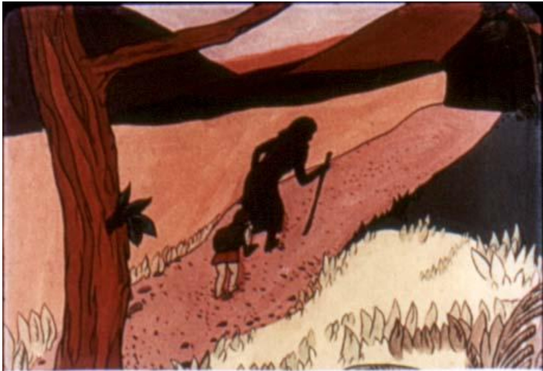
Ананси пожадела старушку и пошла за ней и её хижине.