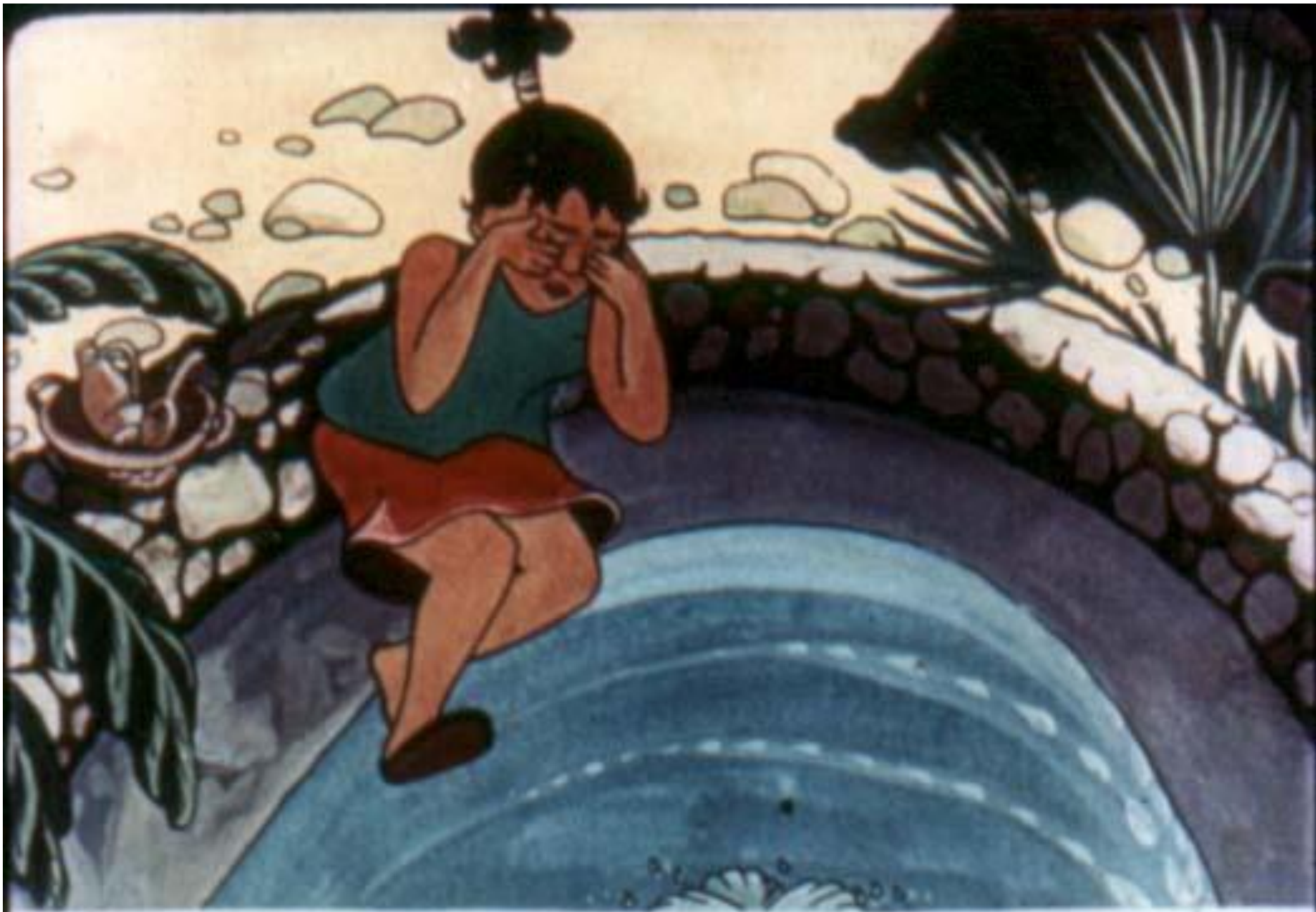
Не задумываясь Аниеси прыгнула в холодную воду...