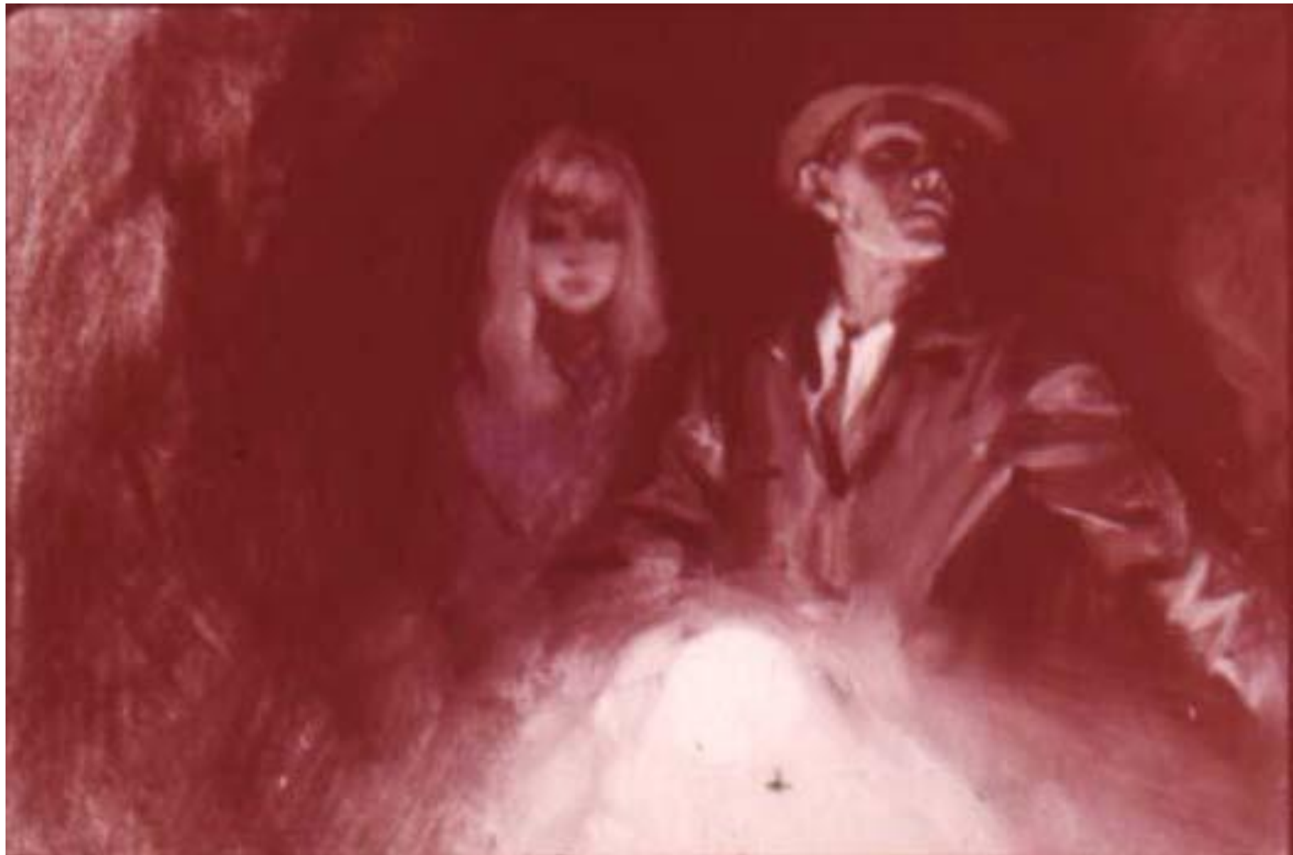
От утомления у Флеминга кружилась голова, и он дважды неверно выбирал дорогу в тёмных переходах.