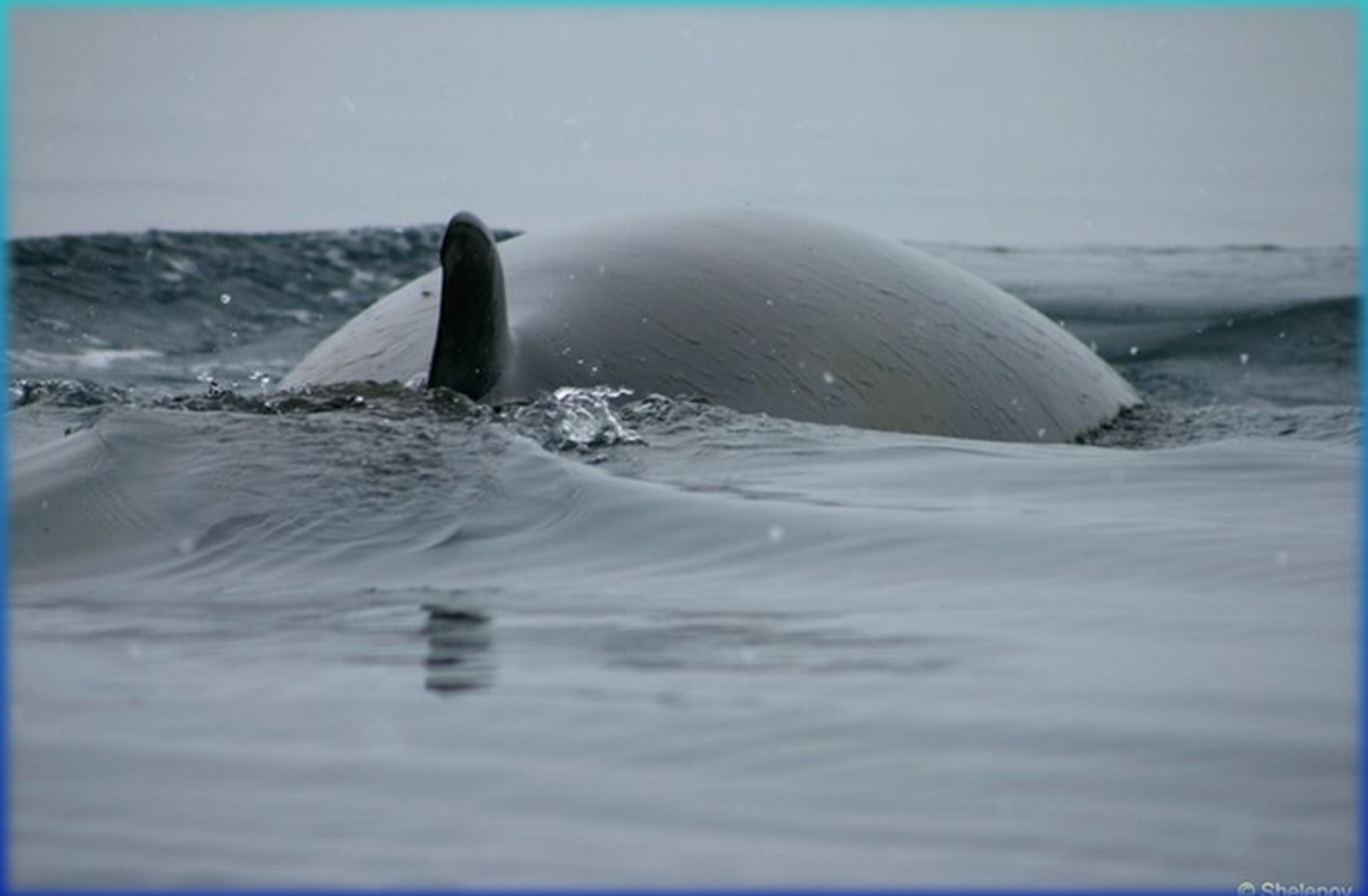
КИТ МАЛЫЙ ПОЛОСАТИК