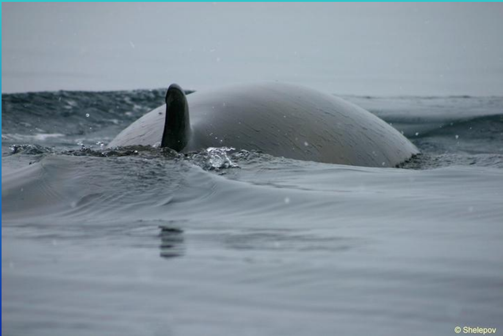
Кит малый полосатик