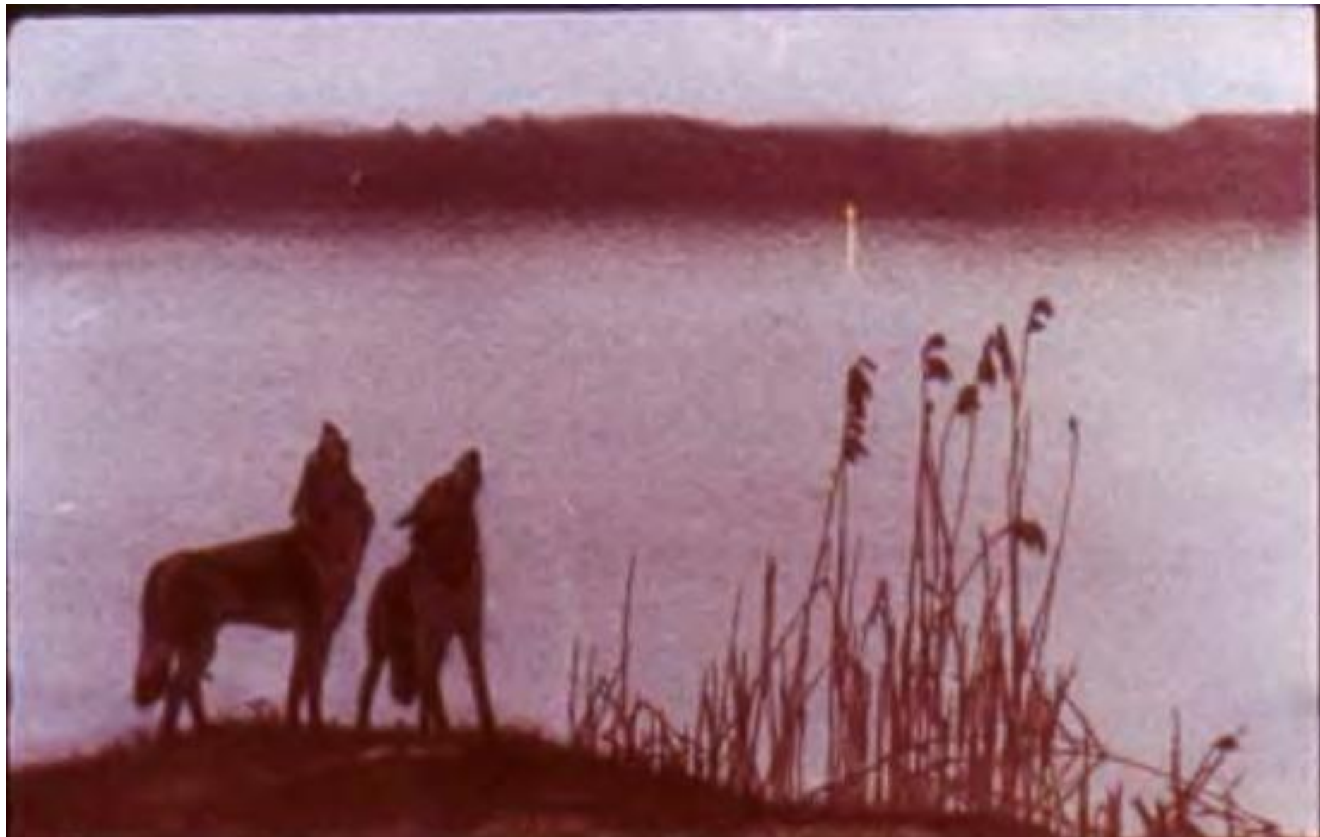
У нас на стоянке горел костёр. Мы жгли его весь день и ночь напролёт, чтобы отгонять волков —они тихо выли по дальним берегам озера.