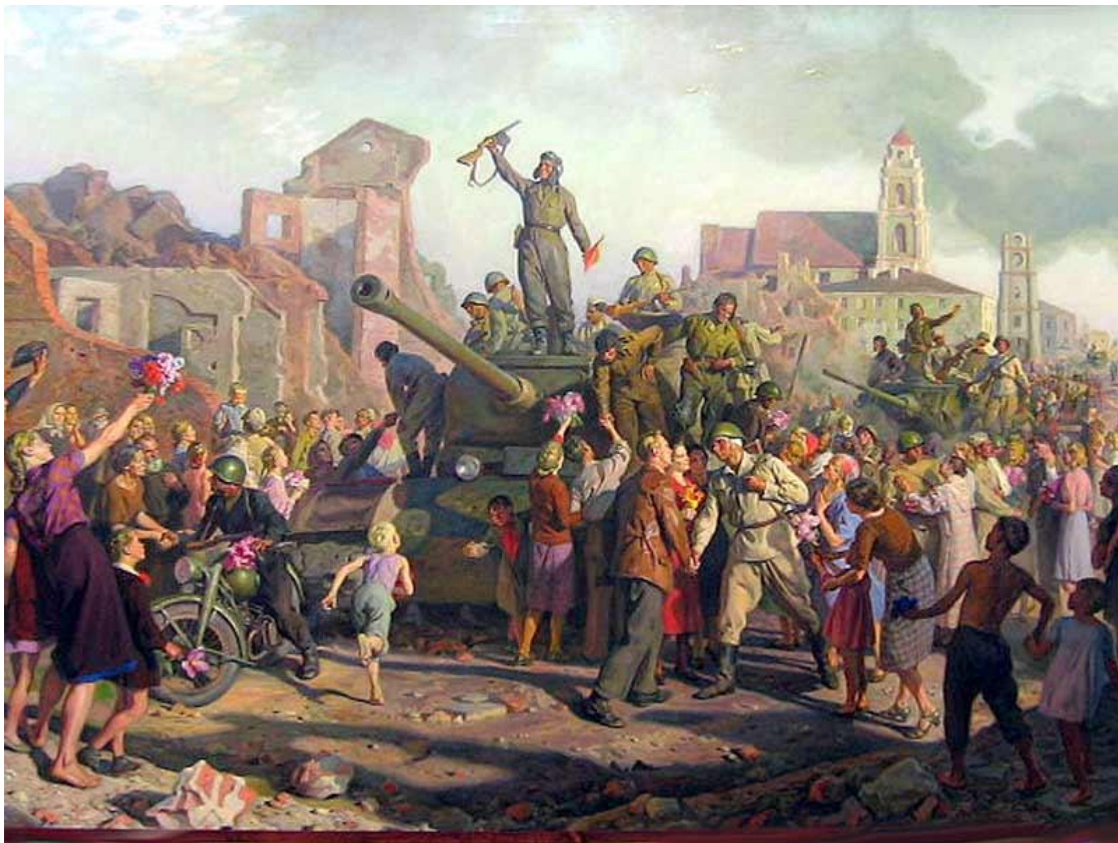
Фрагмент монументального полотна минского художника В.В. Волкова. «Освобождение Минска»