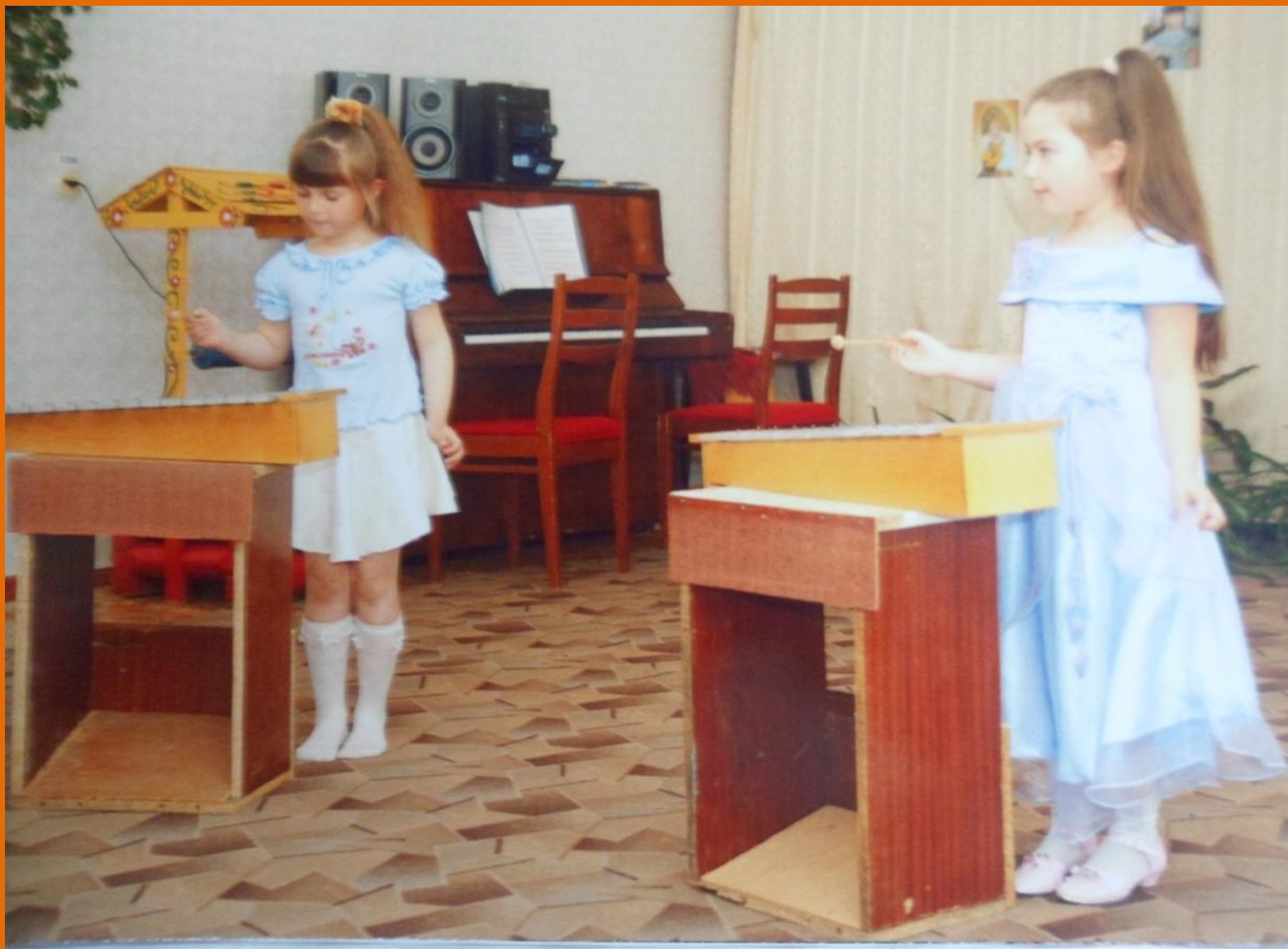
Инструментальная пьеса «Две лягушки»