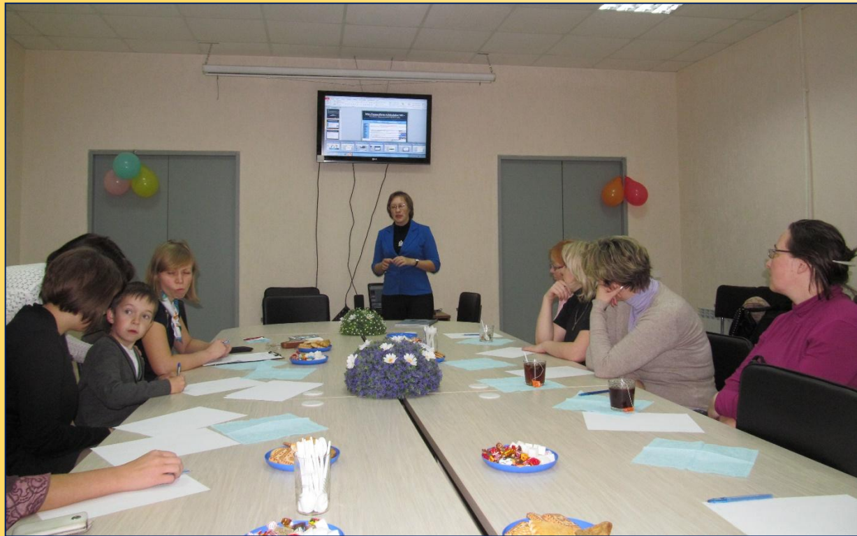
Диалог в «Диалоге» /клуб для родителей при ЦСЗН с. Корткерос