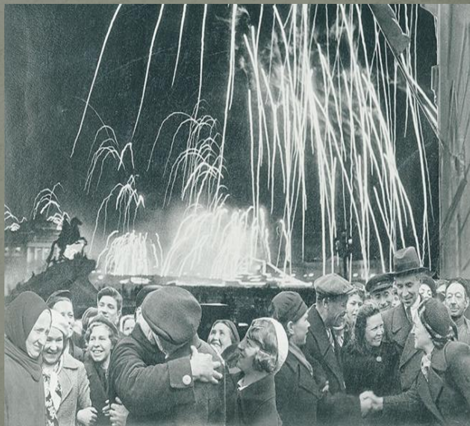
«Великая победа одержана советскими войсками под Ленинградом:»

«...И снова мир с восторгом слышит салюта русского раскат. О, это полной грудью дышит освобождённый Ленинград