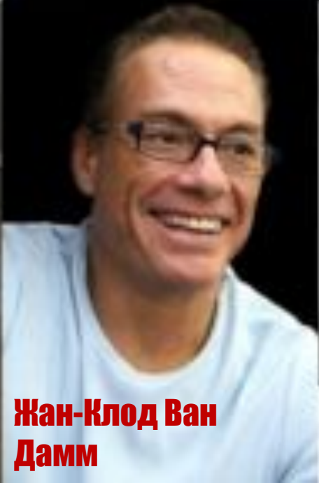
Жан-Клод Ван Дамм