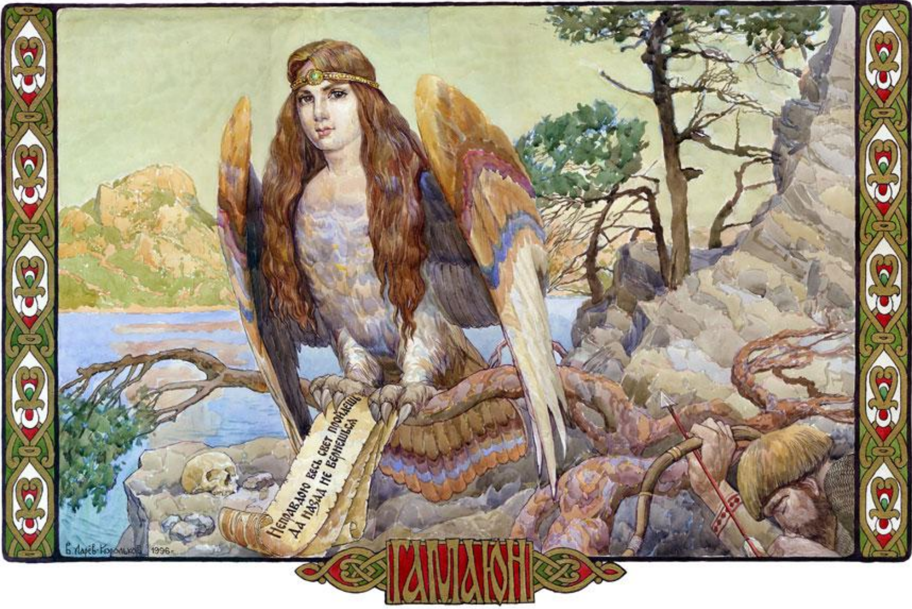
Гамаюн - вещая птица, посланница славянских богов, поющая людям божественные гимны и предвещающая будущее.