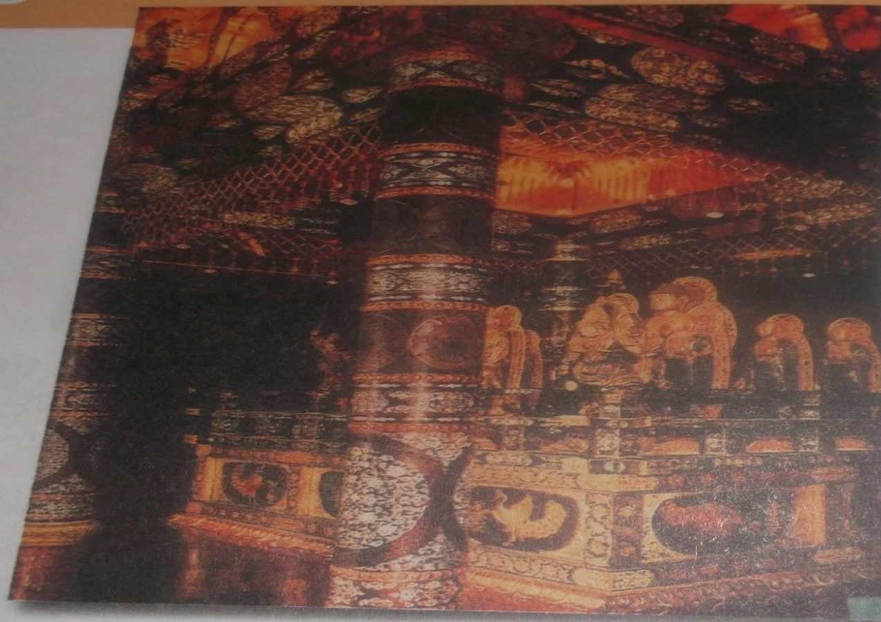
Алтарь буддийского монастыря

из пес кая го Мéру. земно ливак У в том ков, ходи кону теле при В мон щи