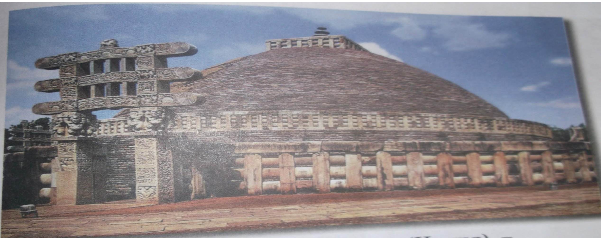
Большая ступа в Санчи (Индия) – крупнейшее сооружение