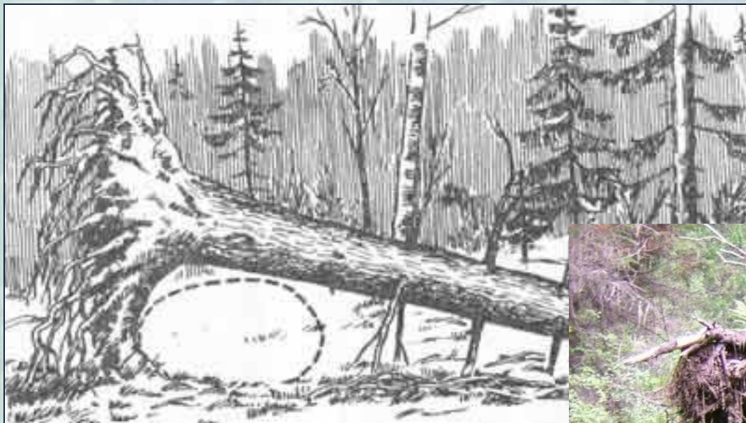
Схема устройства медведем берлоги.

Напрасно искать зимой медвежьи следы. Медведь недаром залегает в берлоге ещё до снега. Для него было бы опасно делать это позднее – по следам легко отыскать берлогу.