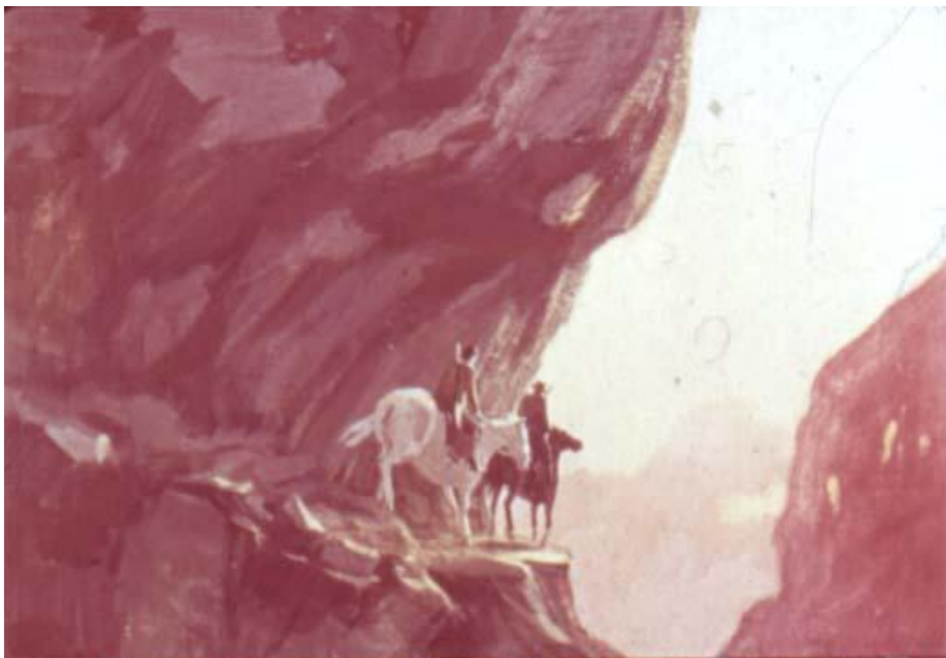
По узкой тропе ехали двое: Журналист и Лесничий.