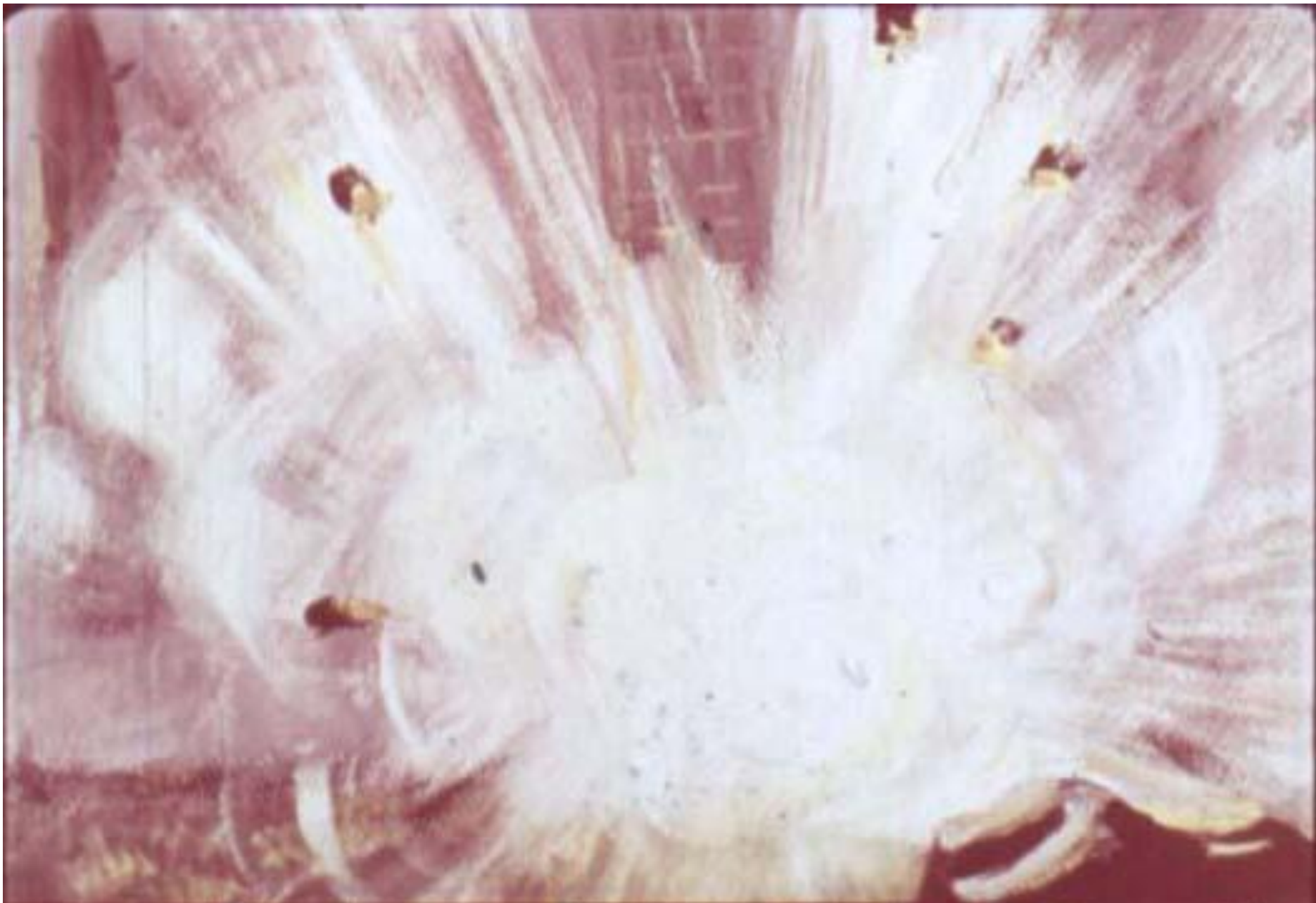
Раздался взрыв. Грохот понатился по залам.