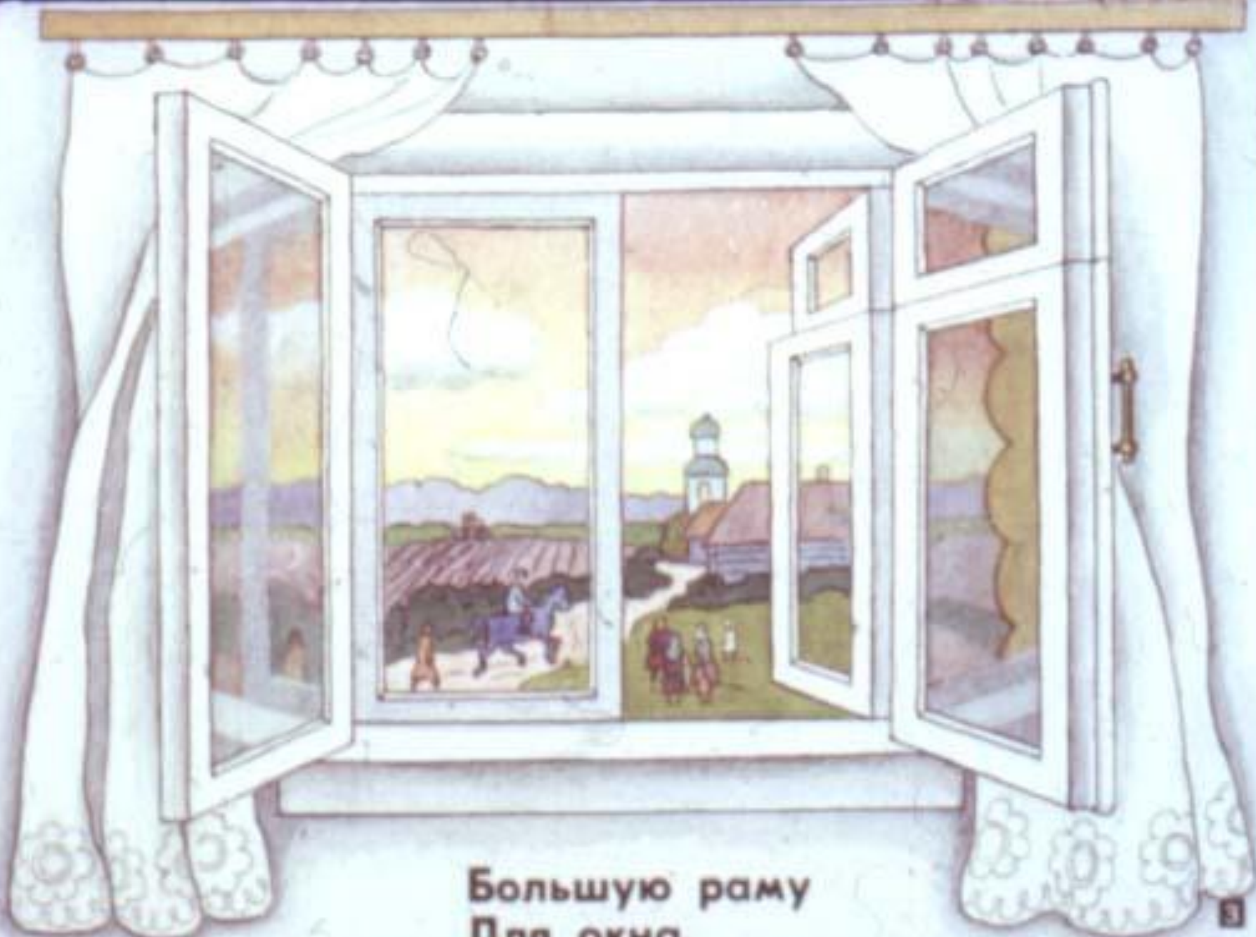
Большую раму Для окна.