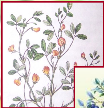
Растение семейства бобовых