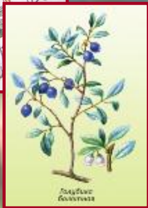
Растение семейства брусничных