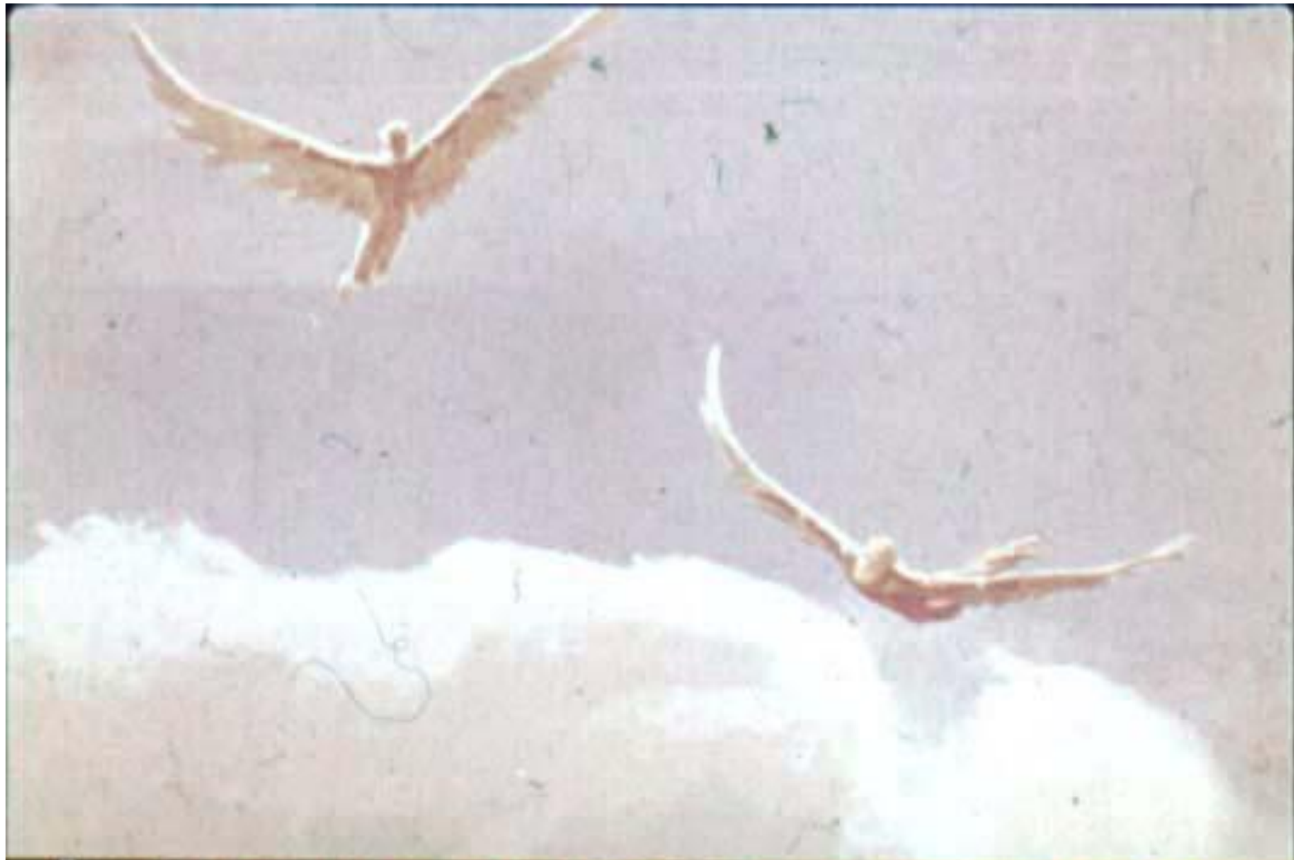
Двумя быстрыми птицами неслись они по воздуху мимо медленно плывущих облаков.