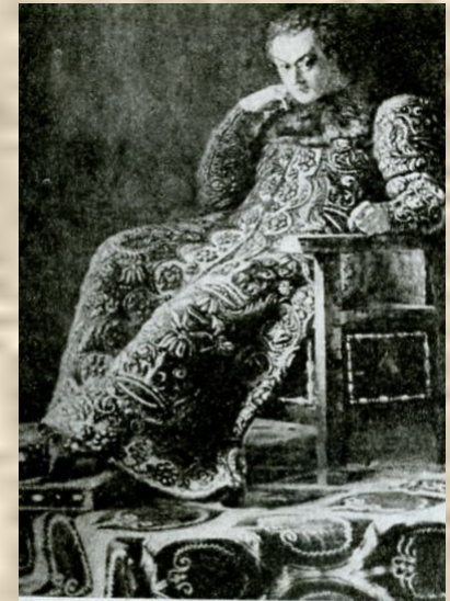
А. Карелин. Лжедмитрий I