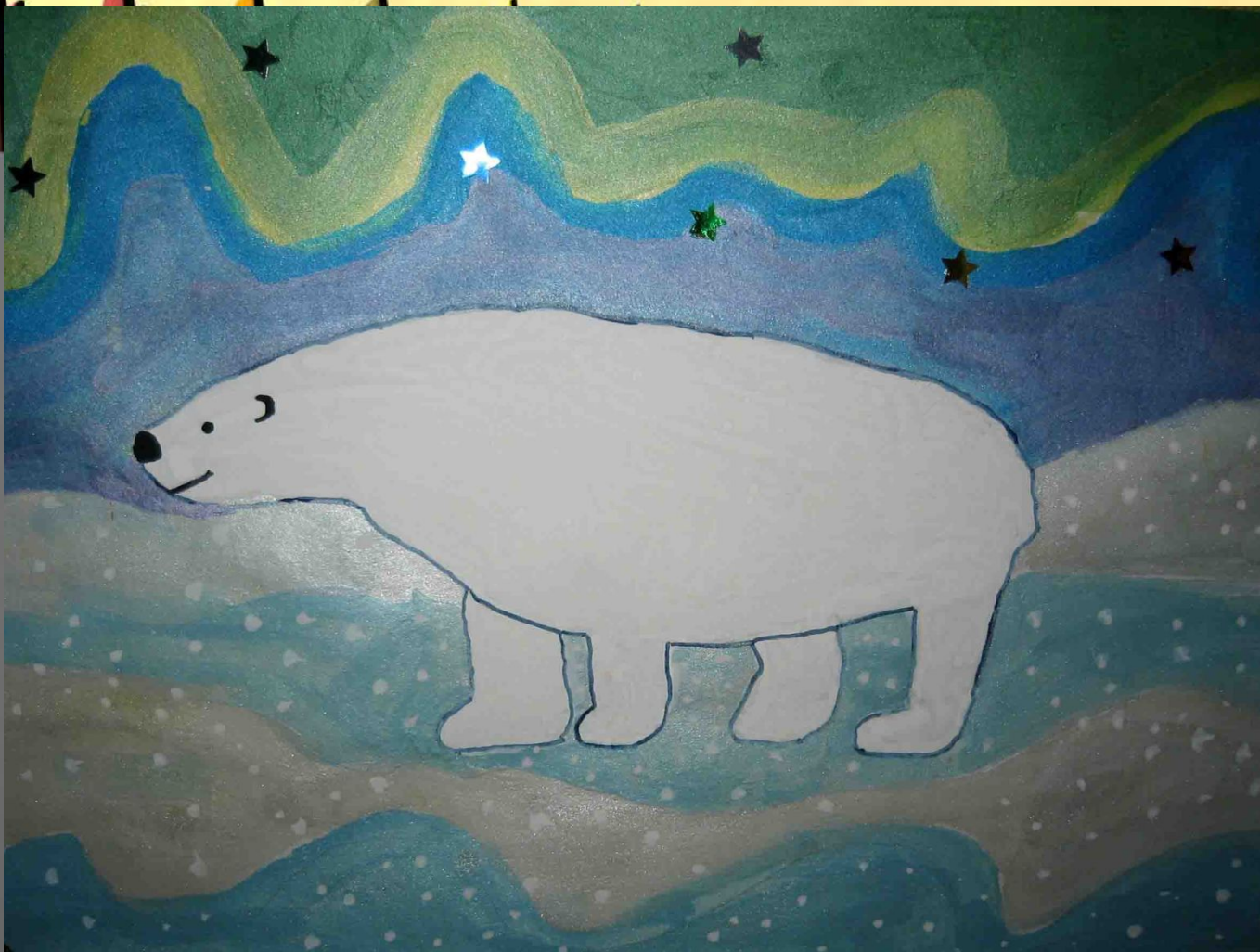
Рисунок "Мишка на севере."