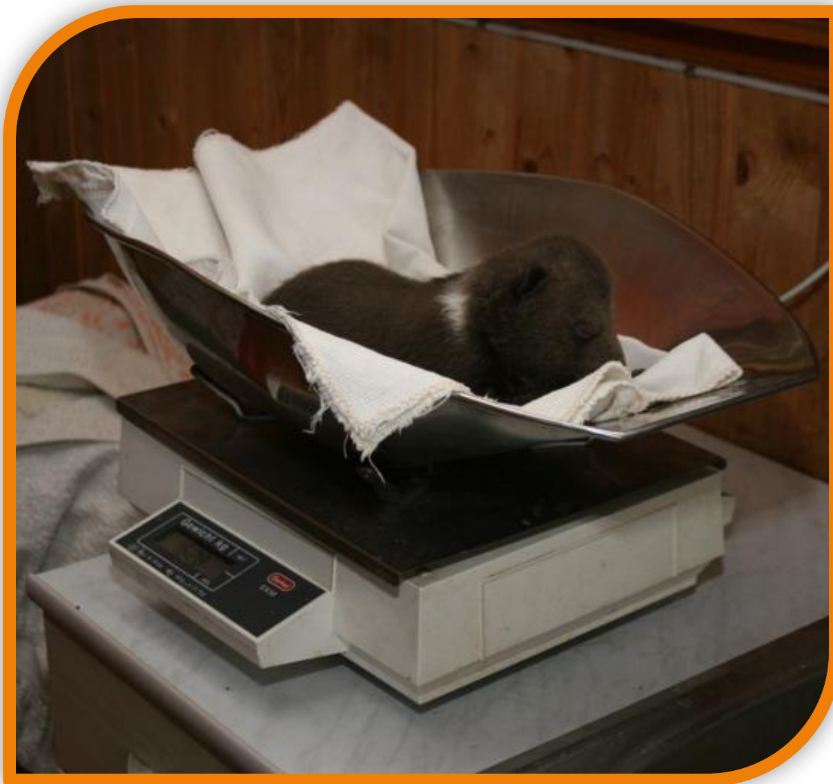
Борис - имеет вес 1530 г.