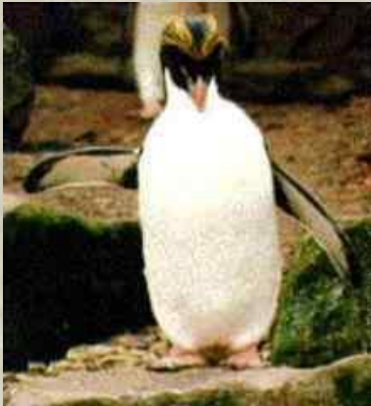
ПИНГ В ИН