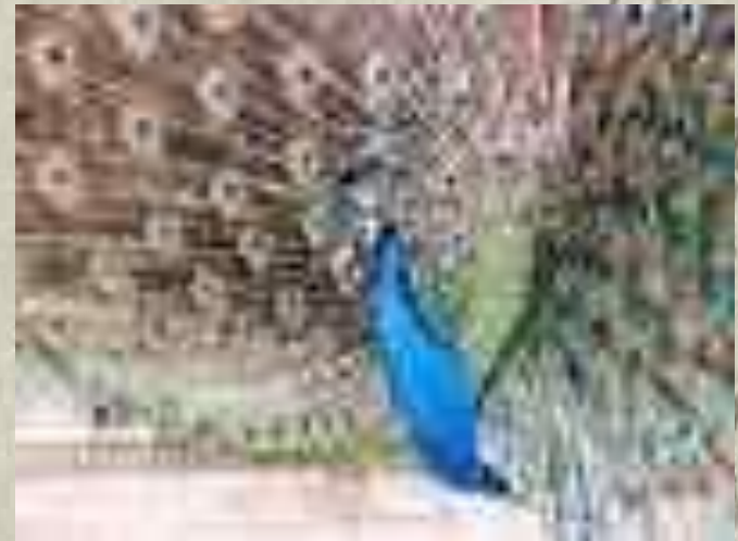
ПА В ЛИН