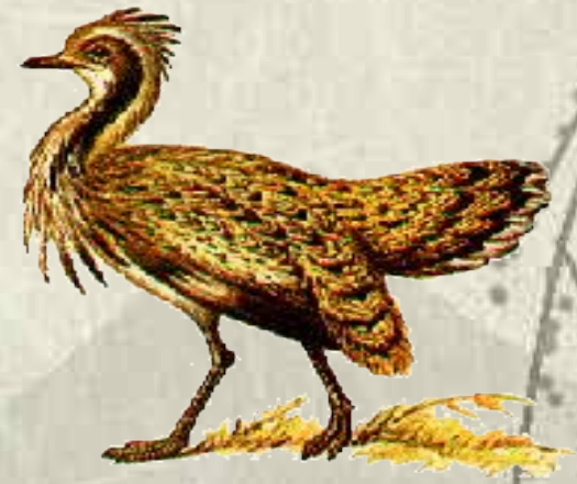
ДРО Ф А