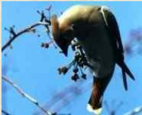
С В ИРИСТЕЛЬ