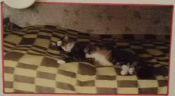
Моя киска - Уриска.

Сейчас у меня живут рыбки - Гулли. Их зовут Гильберта и Аурелия. У них уже 20-миллиметровый размер. А они, судно, предпочитают жить в воде, востриве как они плавают. Они очень красивые, у них необычный окрас.