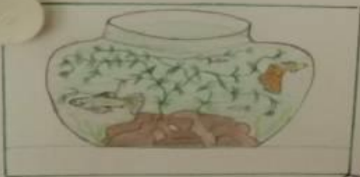
Мои рыбки - Гулли.