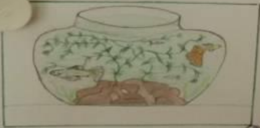
Мои рыбки - Гулли.